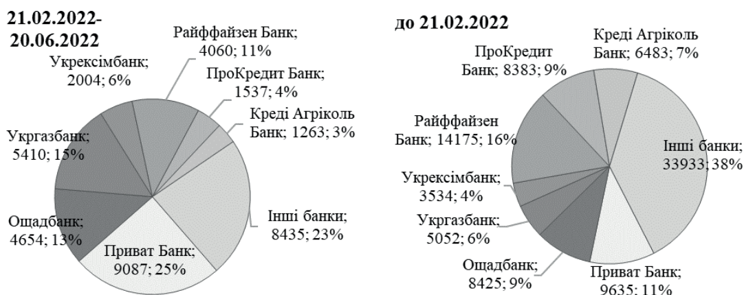
Рис. 3. Сума кредитів, виданих за програмою «Доступні кредити «5-7-9 %», млн грн

Подібну ситуацію можна спостерігати і при аналізі суми кредитів, виданих за програмою «Доступні кредити «5-7-9 %» (рис. 3).