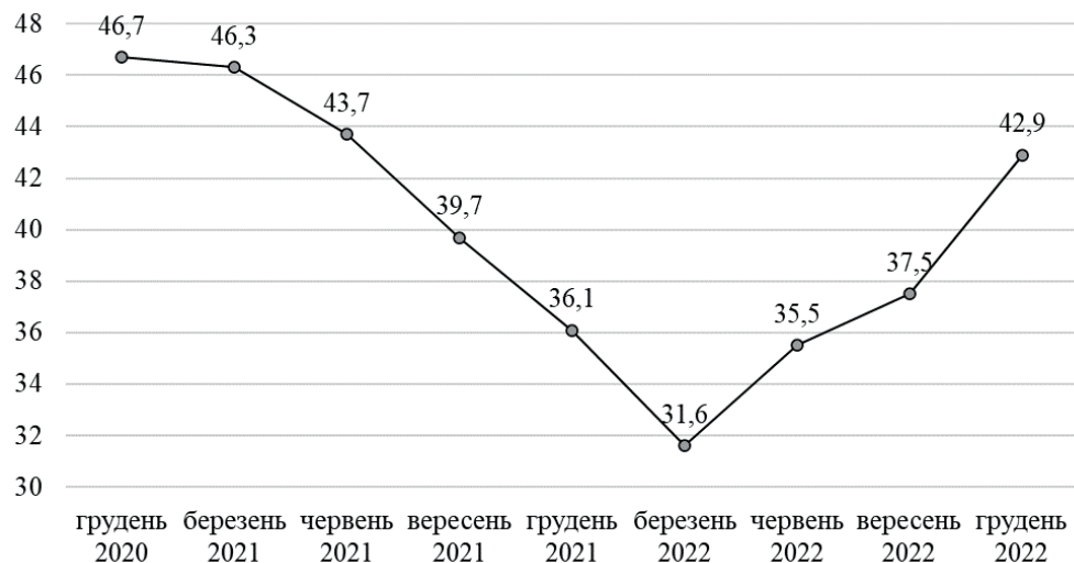
Рис. 1. Частка непрацюючих кредитів, наданих суб'єктам господарювання, у портфелях банків

На рис. 1 чітко простежується динаміка покращення ситуації у сфері банківського кредитування у 2021 р., про що свідчить щоквартальне значне зниження частки непрацюючих кредитів: з 46,7 % у грудні 2020 р. до 31,6 % у березні 2022 р., тобто на 15,1 відсоткових пунктів. Початок повномасштабної війни і введення воєнного стану спричинили збільшення частки непрацюючих кредитів. Зауважимо, що збільшення частки непрацюючих кредитів розпочалося у червні – це пов'язано з закінченням «вимушених кредитних канікул», що посприяло визнанню прострочення понад 90 днів.