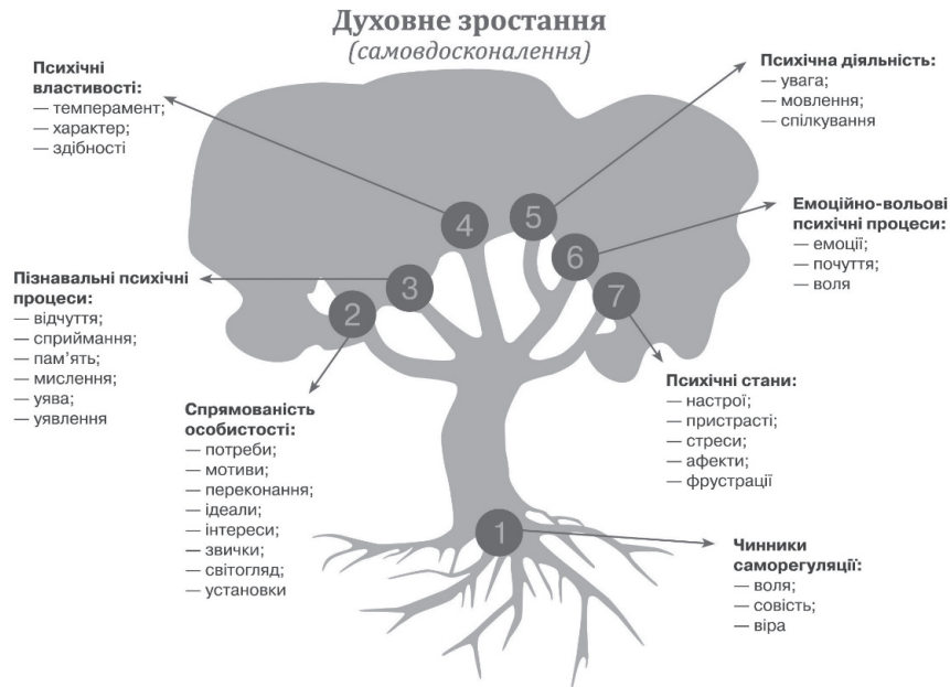
Рис. 1. Психологічна структура особистості за С. Максименко, Н. Жигайло

Авторська модель інформаційного духовного становлення особистості містить у собі інструментальний, потребово-мотиваційний та інтеграційний складники (рис. 2).