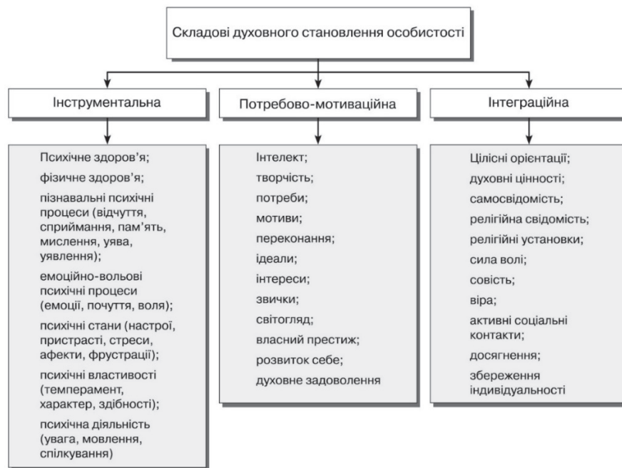
Рис. 2. Авторська модель інформаційного духовного становлення особистості

Авторська модель інформаційного духовного становлення особистості містить у собі інструментальний, потребово-мотиваційний та інтеграційний складники (рис. 2).