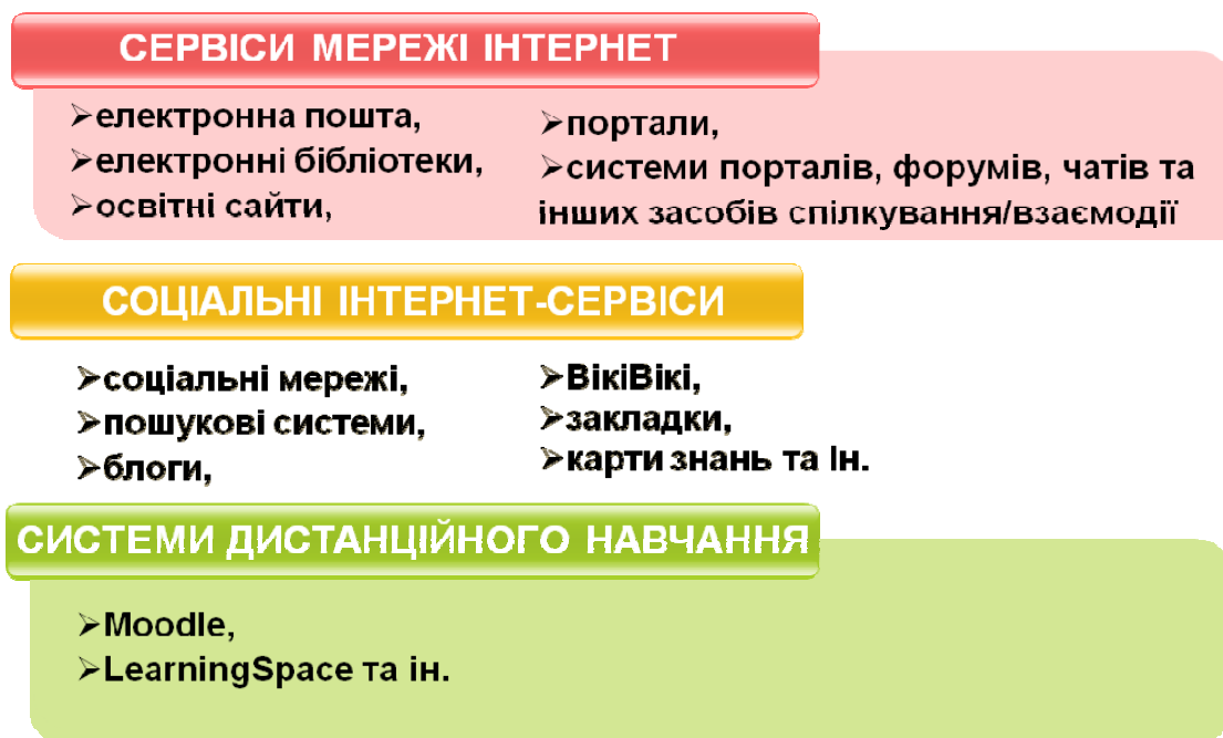
Рис. 6. Сервіси у навчальному процесі

Отже, здійснивши аналіз професійної діяльності учителя, можна зробити висновок, що використання електронних освітніх ресурсів та хмаро орієнтованих засобів навчання з кожним роком займають все більшу його частину та присутні на усіх етапах навчального процесу, незалежно від предмету. Тому розвиток цих засобів та ресурсів стає все стрімкішим, що вимагає підготовки учителів до їх використання та самостійного виготовлення.