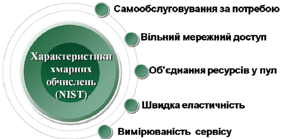
Рис. 1. Характеристики хмарних обчислень за документами NIST (Національного інституту стандартів США)

Також було визначено загальні характерні властивості хмарної моделі використання сервісів (рис. 2) [12].