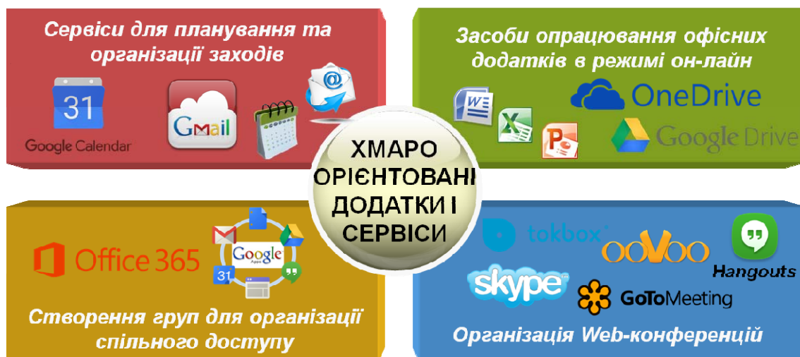
Рис. 5. Класифікація хмаро-орієнтованих додатків та сервісів для використання у навчальному процесі навчального закладу

У навчальному процесі навчальних закладів, окрім спеціалізованого програмного забезпечення, що застосовується для викладання окремих навчальних дисциплін, застосовуються численні універсальні хмаро орієнтовані додатки і сервіси (рис. 5).