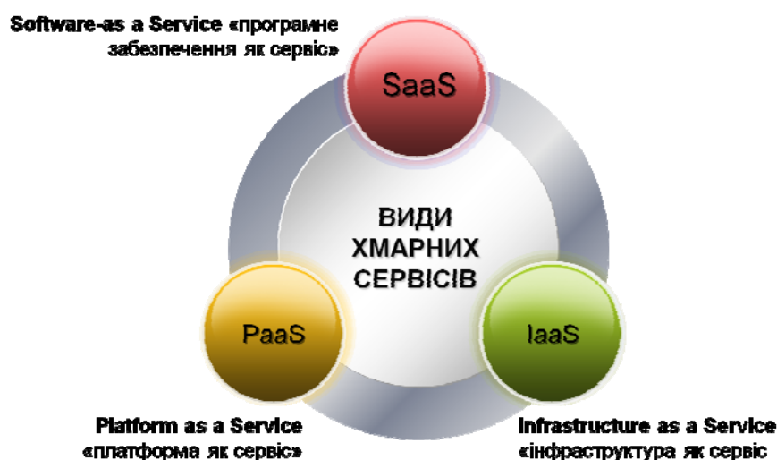
Рис. 4. Види хмарних сервісів

Наразі існує три види хмарних сервісів (рис. 4):