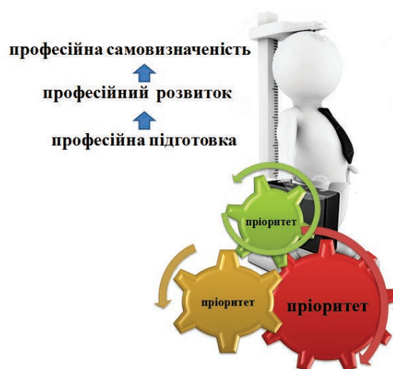
Рис. 2. Роль пріоритетів у процесі становлення випускника педагогічного закладу вищої освіти.

Процес формування високо компетентного майбутнього педагога досить складний та багатогранний, він передбачає професійну підготовку, яка стимулює професійний розвиток студентів та веде до їх професійного самовизначення. Проте, на нашу думку, цей процес приводять в рух саме пріоритети професійного становлення самого педагога (Рис. 2.).