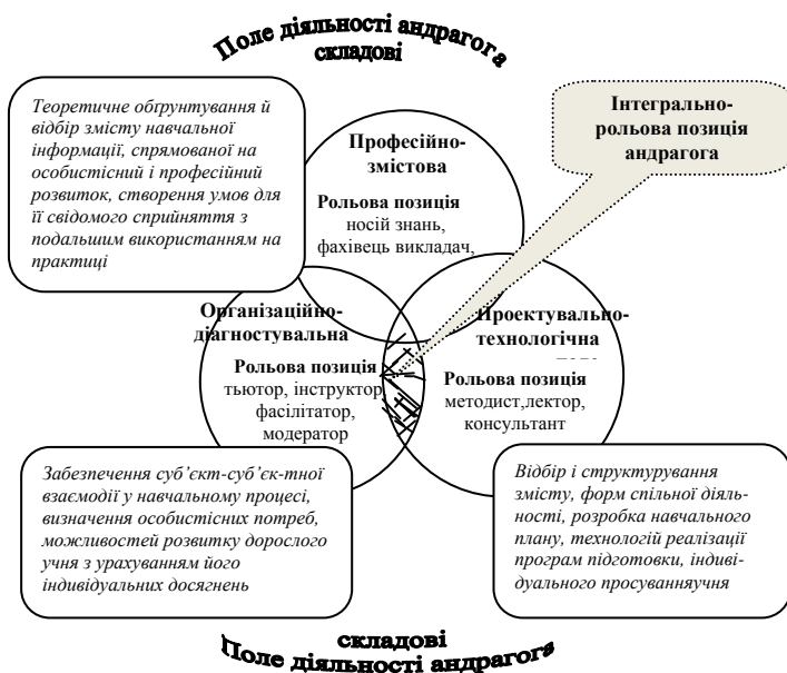
Рис. 2. Інтегрально-рольова позиція андрагога

3) організаційно-діагностувальній (забезпечення суб'єкт-суб'єктної взаємодії у навчальному процесі, визначення особистісних потреб, можливостей розвитку дорослого учня з урахуванням його індивідуальних досягнень) (рис. 2).