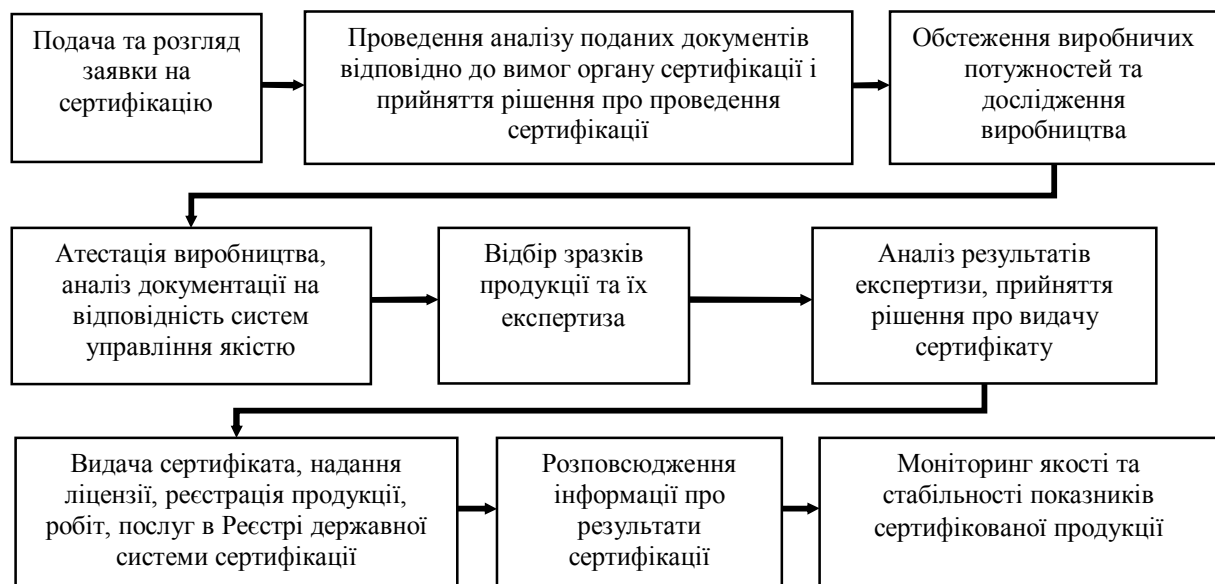
Рис. 2. Порядок здійснення процесу сертифікації в Україні

Власне процес сертифікації продукції включає дев'ять етапів (рис. 2).