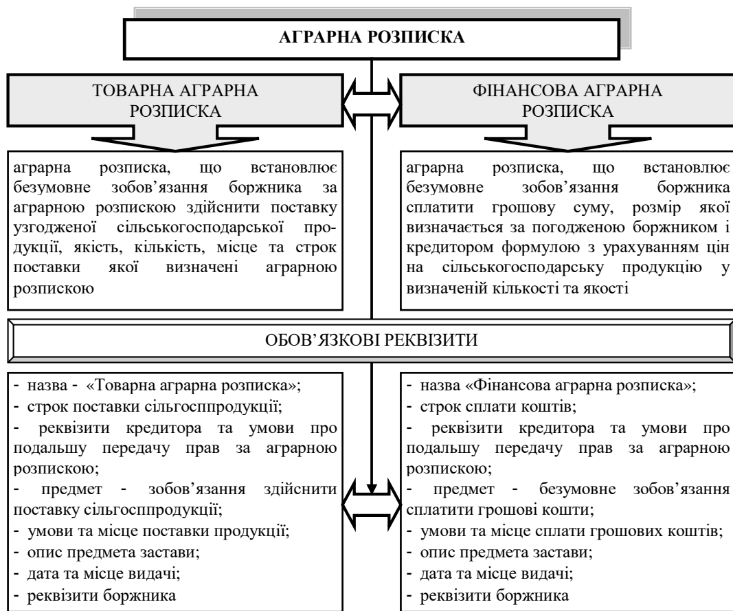
Рис. 1. Сутність та види аграрних розписок

Залежно від виду зобов'язання аграрні розписки поділяються на товарні та фінансові (рис. 1). Законодавством визначено, що аграрні розписки можуть видаватися особами, які мають право власності на земельну ділянку сільськогосподарського призначення або право користування такою земельною ділянкою на законних підставах для здійснення виробництва сільськогосподарської продукції [12].