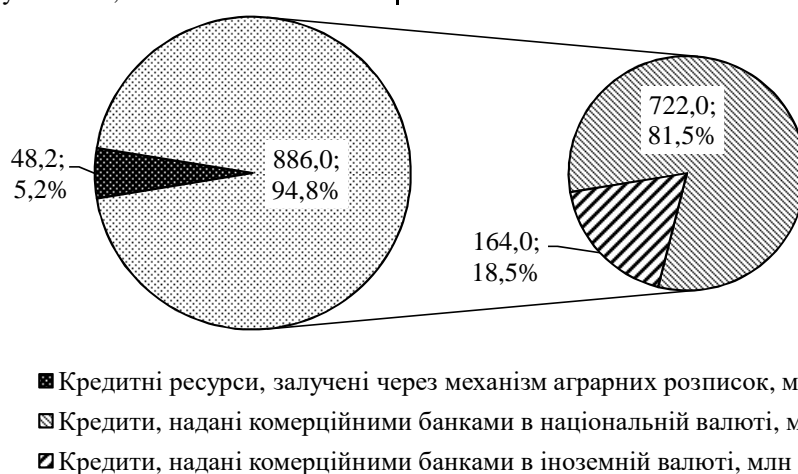
Рис. 3. Джерела залучення кредитних ресурсів сільськогосподарськими підприємствами Вінницької області, станом на I півріччя 2016 р.

За даними Департаменту агропромислового розвитку Вінницької обласної державної адміністрації [6] за перше півріччя 2016 р. сільськогосподарські підприємства Вінниччини уклали 24 аграрні розписки на суму 48,2 млн. грн., що становить 5,2 % від загальної суми залучених кредитних ресурсів (рис. 3). При цьому частка кредитних ресурсів, отриманих від реалізації механізму аграрних розписок на сільськогосподарських підприємствах областей, що задіяні у пілотному проекті «Аграрні розписки», в загальній структурі залучених кредитних ресурсів станом на серпень 2016 р. становила лише 3,0 %.