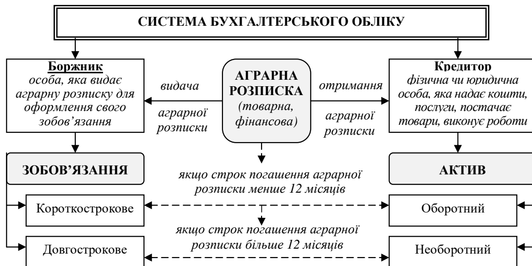
Рис. 4. Аграрна розписка в системі об'єктів бухгалтерського обліку

З юридичної точки зору сутність аграрної розписки полягає у тому, що кредитору надається право вимагати від боржника кошти або продукцію за раніше надані фінансові або матеріально-технічні ресурси. В боржника за аграрною розпискою виникає зобов'язання здійснити на погоджених з кредитором умовах поставку продукції або сплатити визначену суму коштів. Залежно від строків виконання цього зобов'язання (ЗУ № 5479-VI передбачено, що сторони можуть домовитись про перенесення строку виконання зобов'язань на наступний маркетинговий рік) у боржника виникає короткострокова або довгострокова заборгованість. Натомість аграрна розписка для кредитора залежно від строку її погашення є оборотним або необоротним активом (рис. 4).