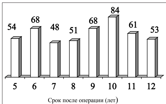
Рис. 6. Диаграмма распределения пациентов в зависимости от сроков оценки результатов лечения

ях отмечена миграция винта, сопровождавшаяся синовитом, что составило 0,9 %. Были выполнены артроскопии с удалением винта и локальной синовэктомией. Повторные операции проведены в сроки 7 и 9 мес. после первичной, отмечено стабильное состояние трансплантата.