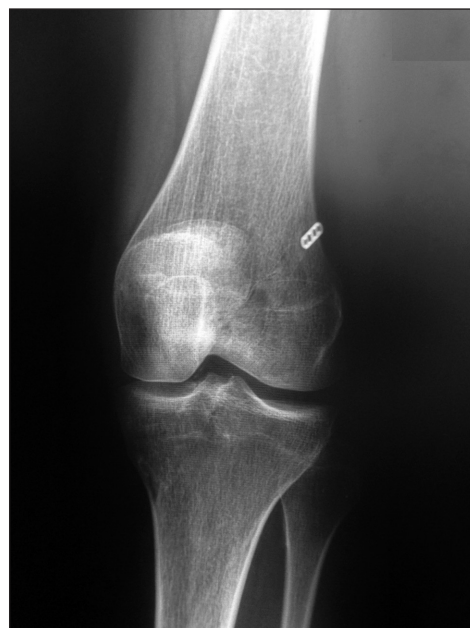
Рис. 1. Фиксация трансплантата STG пластиной «Endobutton» проксимально и интерферирующим винтом PLLA к большеберцовой кости

Выполнен анализ сочетания применения дистального и проксимального фиксаторов (табл. 3, 4). Это дало возможность выделить три основные группы пациентов: 1) фиксация трансплантата интерферирующими винтами из полимолочной кислоты (157 трансплантатов STG и 33 трансплан-