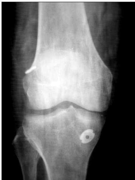
Рис. 2. Фиксация трансплантата STG Пластинкой «Endobutton» проксимально и титановой пуговицей к большеберцовой кости