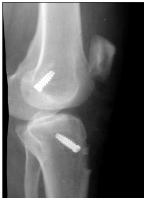
Рис. 3. Фиксация трансплантата БТВ титановыми винтами

тата БТВ), 2) проксимальная фиксация пластинкой «Endobutton», а в большеберцовой кости — интерферирующим винтом PLLA (41 трансплантат STG и 20 трансплантатов БТВ); 3) проксимальная фиксация пластинкой «Endobutton», а в большеберцовой кости — титановой пуговицей (111 трансплантатов STG и 24 трансплантата БТВ). Результаты лечения пациентов оценены по шкале IKDC в зависимости