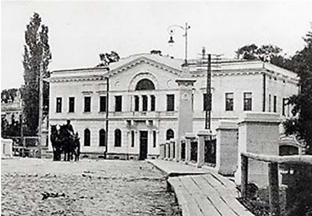
Рис. 1. Вигляд головної контори Харитоненка на початку ХХ ст.

з даху та з прилеглої території не забезпечували захисту конструкцій від замокання. Як наслідок, зовнішня поверхня стін була пошкоджена дією вологи та морозного вивітрювання.