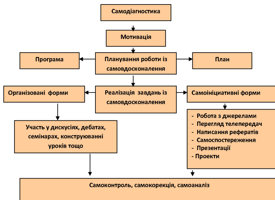
Схема 3. Алгоритм самоосвітньої діяльності учня