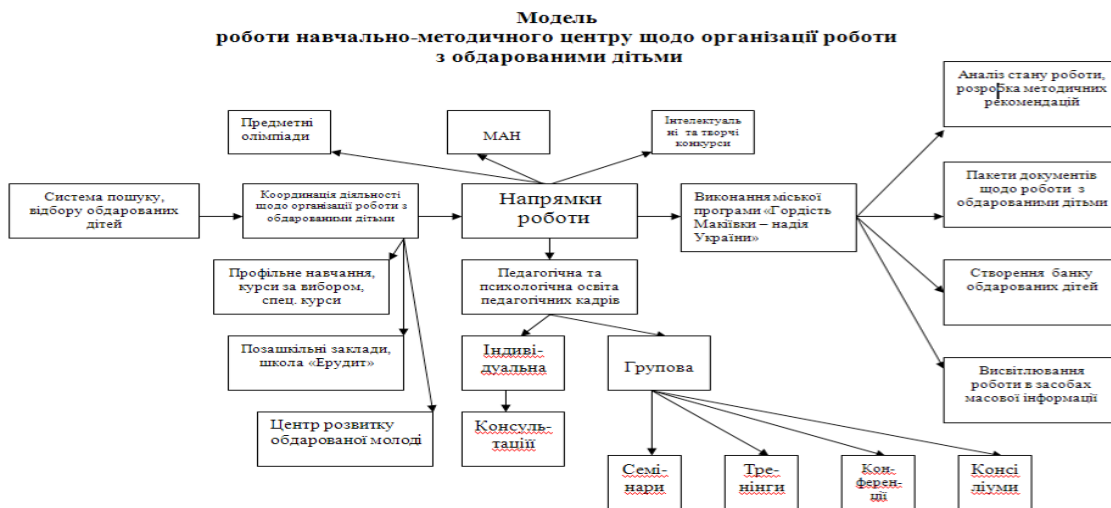
Схема 1. Модель роботи навчально-методичного центру щодо організації роботи з обдарованими дітьми

Процесуальний аспект реалізації цієї моделі потребує використання комплексного, системно-структурного підходів і повинен охоплювати всі ланки педагогічної системи (див. табл. 1):