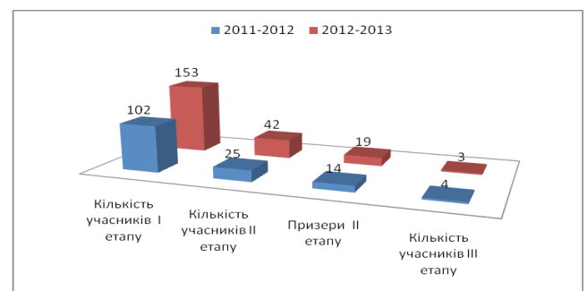
Схема 2. Кількість призових місць, отриманих учнями міста (I-II етапів)

Показником рівня інтелектуального рівня розвитку обдарованих дітей є результативне функціонування Макіївської філії Донецького територіального відділення Малої академії наук України (див. схему 2).