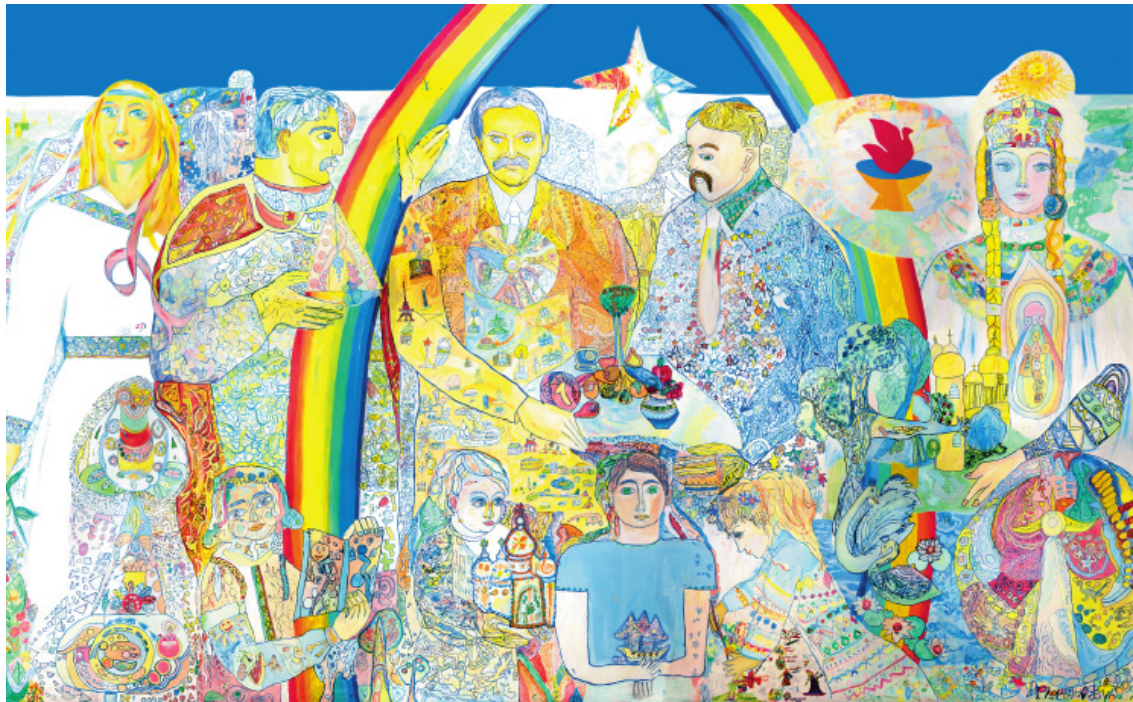
Фото 2. Фрагмент монументального розпису в класі живопису «Зоряний Київ – Світ Абсолютної Гармонії і Досконалості» – «Майстер-клас В. В. Лубенка» (2000 – 2004 рр)

Об'єднання зусиль з виконання соціально-корисного інтерактивного проекту «Подарунок Києву» – оформлення мозаїкою і живописом входу до навчального закладу № 263 (вул. Сабурова, 19-б) – «Київ – Земля, що співає радістю і щастям» (57,4 кв. м мозаїки і 14,2 кв. м монументального живопису – центральна частина, 25 кв. м мозаїки – південний фасад), у створенні якого взяли участь понад 120 дітей, 20 батьків-ентузіастів, 16 ентузіастів-учителів і більше десяти організацій-спонсорів, є результатом навчально-виховного процесу і свідченням активної життєвої позиції дітей, батьків, громадськості і життєдіяльності авторської системи В. В. Лубенка і «Школи Володимира Лубенка» в Україні (див. фото 3, 4, 5, 6).