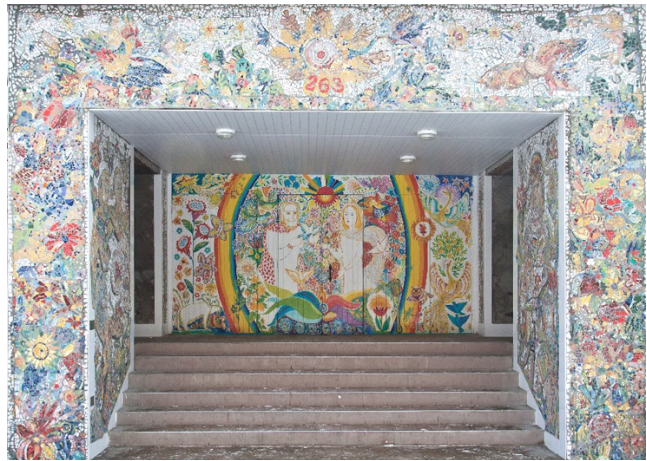
Фото 5. Соціально-корисний, інтерактивний проект «Подарунок Києву» – оформлення мозаїкою і живописом фасаду школи № 263 Деснянського району м. Києва

У процесі організації художньо-виховної діяльності протягом навчального року здійснюється індивідуальна і фронтальна робота з дітьми за «стрижневими програмами» і планами, орієнтованими: на першому році навчання на «тренінг уваги і виховання почуттів»; на другому – організацію «системи мислення і почуття»; на третьому – «організацію свідомості»; на четвертому – «самоформування»; на п'ятому – «творчу реалізацію». Якщо на заняттях живописом досліджуються «крапки», на музиці – «звуки», на гармонії – «жести», відкривається культура і виразність рухів, народжуючи дивовижні за пластикою і незвичайні за задумом хореографічні, живописні або мозаїчні композиції, поезія та казки. Звідси третій принцип: «метод зворотного зв'язку» , що означає: взаємодію розуму і почуттів, з метою спрямування їх на організацію гармонії цих двох начал в людині заради гармонійного багатогранного розвитку особистості шляхом природного, вільного сприйняття інформації [15].