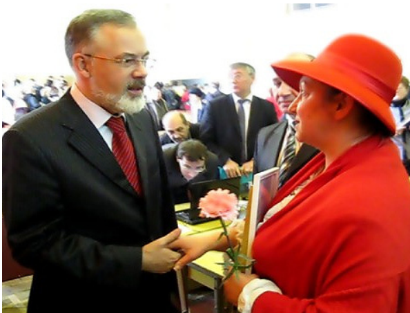
Фото 8. Зустріч з міністром МОН України

творчої співпраці на загальних зборах Національної академії педагогічних наук України (2010 р.)