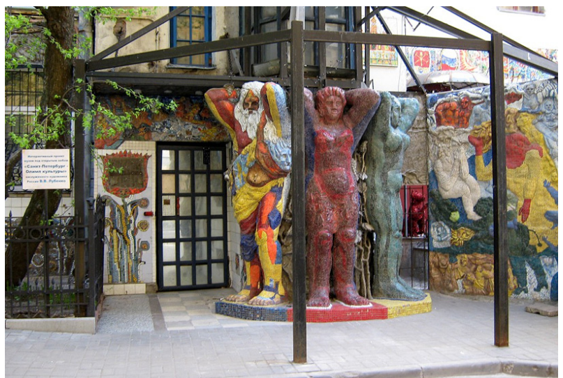
Фото 7. Скульптурно-мозаїчна композиція «Атланти» інтерактивного проекту «Санкт-Петербург – Олімп культури»

Нижче спостерігаємо, як міністр освіти і науки України Д.В.Табачник вручає диплом на честь 15-річчя