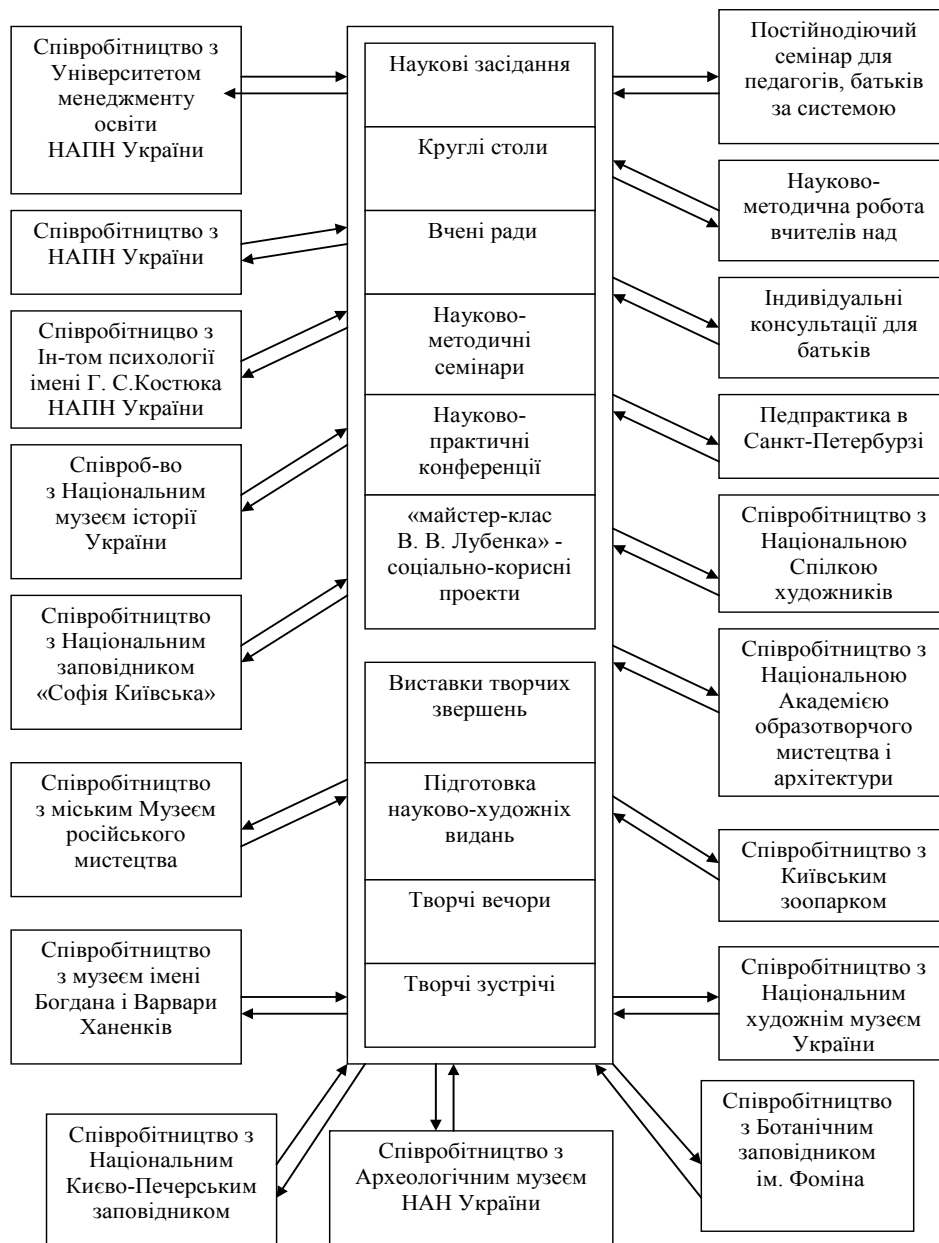
Рис.2. Науково-методична робота «Школи Володимира Лубенка» в Україні

19. Международная культурно-просветительская программа «Киев – Санкт-Петербург. Школа Владимира Лубенко» / Кн. «Национальные лидеры Украины» Украинская конфедерация журналистов. – К., 2012. – С. 412–413.