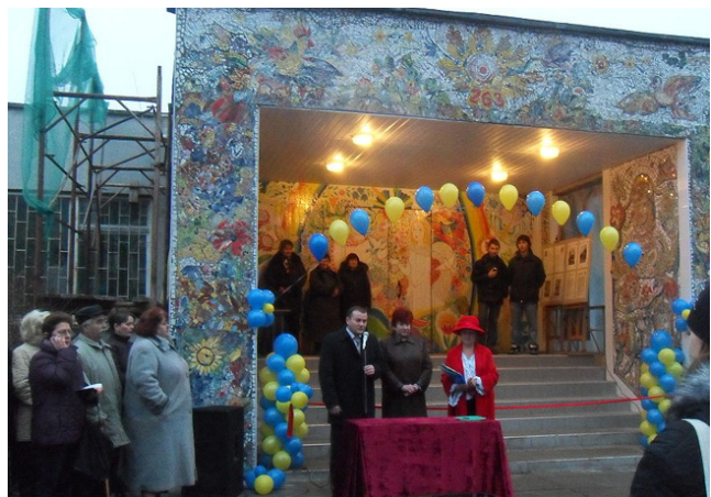
Фото 6. Презентація інтерактивного проекту «Подарунок Києву» – 13 грудня 2011 року