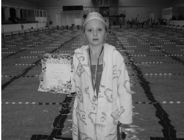
Мої перші нагороди