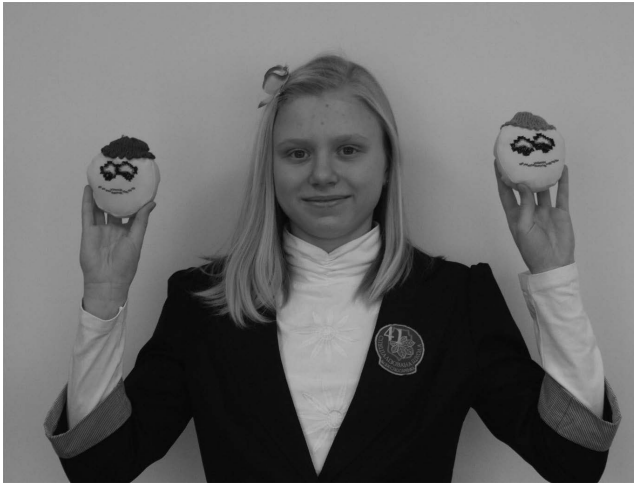
А це також моє хобі

яскравістю, теплою, людяністю, саме такими є і її вироби, зроблені для того, щоб приносити радість іншим.