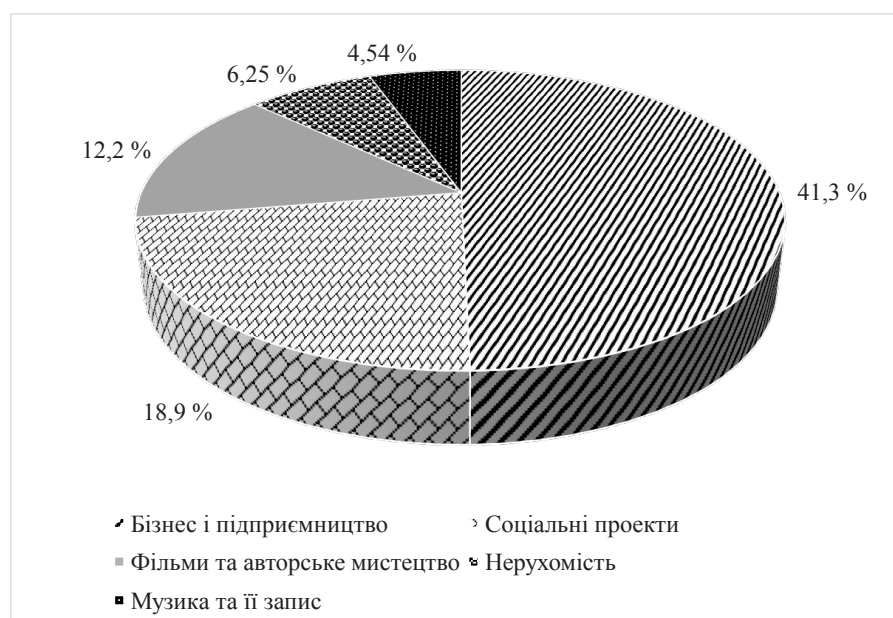
Рис. 3. Розподіл інструментів світового краудфінансування у 2015 році