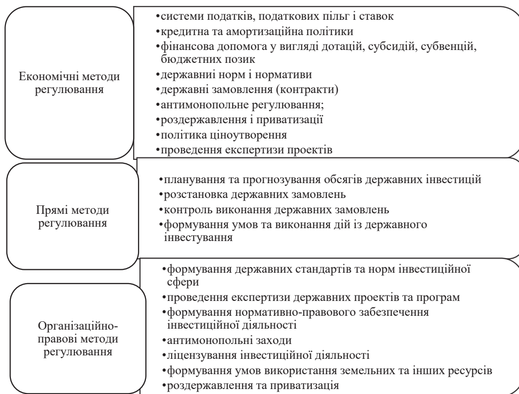
Рис. 1. Складники державного регулювання інвестиційної діяльності