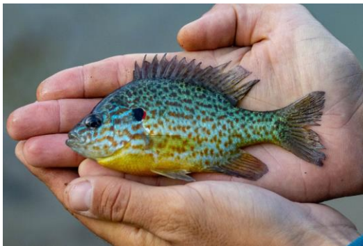
Рис. 2. Сонячний окунь Lepomis gibbosus . Один із представників інвазійних видів у акваторії озера

Зважаючи на той факт, що озеро з'єднане з Дніпром через протоки, а також поєднане із озерами Набреж та Тягле (див. рис. 1) через що можливий міграційний обмін іхтіофауною між цими водоймами, слід зауважити і про сприятливі умови для існування інвазійних видів, які відносно швидко змогли натуралізуватись у озері (ротан-головешка P. glenii , сонячний окунь L. gibbosus (рис 2), іглиця пухлощока S. abaster , колючка триголкова G. aculeatus ). Завдяки високій пластичності, зазначені види освоюють нові водойми у басейні Дніпра [8]. Наявність цих видів позначається на формуванні екологічної структури іхтіофауни озера. Серед аборигенних видів, що населяють прибережні частини озера найбільш представленими були краснопірка S. erythrophthalmus (рис. 3) та гірчак європейський R. amarus . Відомо, що чисельність краснопірки зростає у штучних водоймах за утворення зарослих мілководь, з чим і пов'язані особливості поширення цього виду у досліджуваному озері. Разом з тим, невисока інтенсивність заростання макрофітами навіть за умов сповільненої течії, вірогідно, перешкоджає набуттю краснопіркою масовості. Крім того, нами було виявлено реофільні види – пічкура звичайного G. gobio , білизну A. aspius та головня S. cephalus .