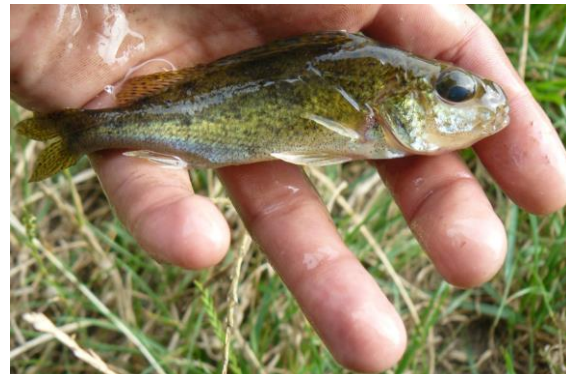
Рис 5. Йорж звичайний G. cernua

Відомо, що на ефективність природного відтворення риб у водоймах має наявність нерестового субстрату. На оз. Мартишів наявний пояс занурених рослин та рослин із плаваючим на поверхні листям. Саме ці групи рослин є нерестовим субстратом для відтворення фітофільних риб. Це вкрай важливо, оскільки, через трансформацію прибережної зони низки озер Києва, зменшилась кількість нерестовищ для фітофільних риб [5]. Через це акваторія оз. Мартишів є надійним резерватом для збереження різних екологічних груп риб, які скоротили свою чисельність або зникли у інших водоймах Києва. Саме тому варто наголосити на важливості акваторії оз. Мартишів як вагової частини для забезпечення біорізноманіття іхтіофауни.