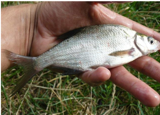
Рис. 4. Лящ A. brama

За способом відкладання ікри в оз. Мартишів домінували фітофіли та псамо-літофіли, вони становили 50 та 26,7% відповідно (табл. 3), що пов'язано із наявністю сприятливих прибережних біотопів, які відіграють важливу роль для відтворення зазначених видів. Передусім – це численні зони весняного підтоплення та порізаність берегів, які формують мілководні затоки з піщаним дном, які відіграють важливе значення для нагулу та розмноження риб, приурочених до піщаного та піщано-галькового ґрунту.