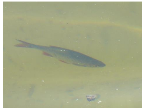
Рис. 3. Краснопірка звичайна Scardinius erythrophthalmus – один із фонових видів аборигенної іхтіофауни

За результатами проведених досліджень було здійснено поділ риб на екологічні групи (табл. 3). За екологічними групами в оз. Мартишів переважали представники заростевих та придонних видів риб, які становили 33,3 та 43,3% відповідно. Відсоткове співвідношення риб придонно-пелагічного та пелагічного комплексів становили 6,6 та 16,6% відповідно. За особливостями живлення переважали бентофаги (50%), передусім: лящ A. brama (рис. 4), плоскирка B. bjoerkna , карась китайський C. auratus , в'юн M. fossilis , йорж звичайний G. cernua (рис. 5), бичок-пісочник N. fluviatilis та бичок тупоносий західний P. semilunaris . Наведені види трофічно залежать від наявності у достатній кількості зообентосу, що може вказувати на високий розвиток первинної продукції в цьому озері. Представники хижих видів риб склали 20%. Варто зазначити, що цей відсоток значно вищий, ніж у антропогенно трансформованих озерах. Наприклад, в озерах Кирилівське та Лугове (системи «Опечень»), де відсоток хижих видів риб становить 11,5 та 9 відповідно [16]. З огляду на це можна зазначити, що наявність та чисельність хижих видів риб в оз. Мартишів вказує на стабільність екосистеми цього озера.