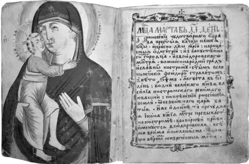
Миняя Четя. Рукопис. XVIII ст. Углич

ній бібліотеці друкованих старожитностей зі штампом «Сталинская городская картинная галерея» дозволяє стверджувати, що рідкісні книжки почали надходити до музею від самого початку його відтворення у 1960-х роках. Бібліофільських видань було, на жаль, обмаль. Спочатку всі книжкові твори без урахування історичної, культурної чи мистецької значущості брали на облік у фонди наукової бібліотеки музею. Невелика кількість цінних екземплярів і їх вельми незадовільний стан не давали можливості провести певне відокремлення. Тому поодинокі книжкові пам'ятки довгий час залишалися на спеціально призначених, закритих полицях бібліотеки, очікуючи на реставрацію й дослідження. Згодом кількість високохудожніх примірників стародруків і рідкісних книг помітно зростає. Багато з них як складова частина мистецької культури могли б увійти до складу побудованих за історико-хронологічним принципом експозицій відділів музею або тематичних виставок.