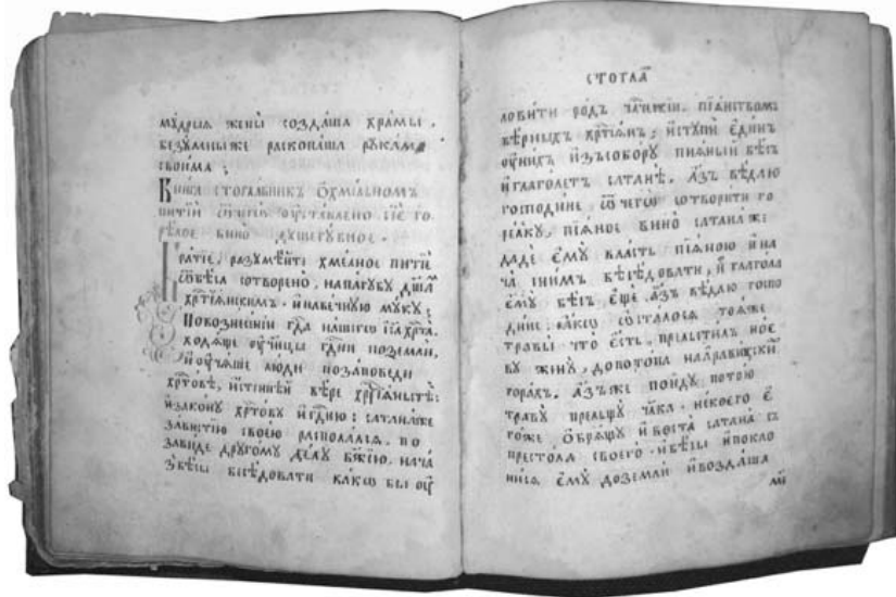
Тифологія. Рукопис. Друга половина XIX ст.