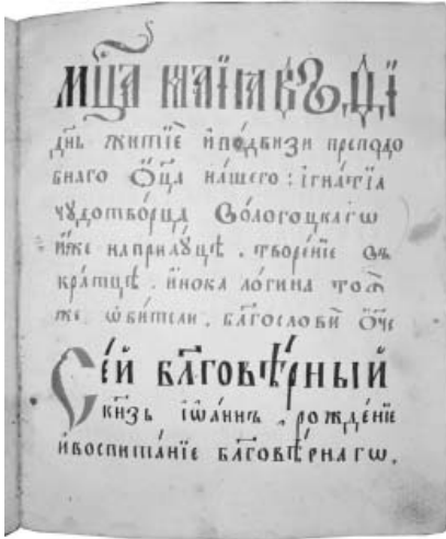
Сторінка з рукопису. Минея Четья. XVIII ст. Углич

серваційних і реставраційних заходів. Тепер книги зберігаються у картонних коробках із зазначенням назв і шифрів у замкнених дерев'яних шафах фондосховища графіки. Спосіб розміщення обрано формальний, за шифрами. Екземпляри, які поступають до фондів колекції, проходять обов'язковий карантин. До постійної експозиції книги не входять. Виставляються з неухильним дотриманням рекомендованої періодичності та лише на обмежений час роботи нетривалих виставок.