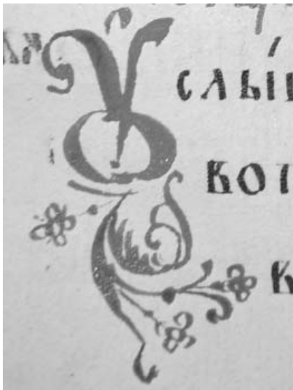
Буквиця з рукопису. Минея Четья. XVIII ст. Углич