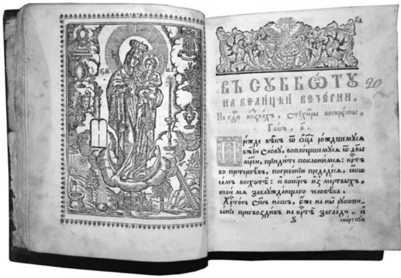
Шестоднев. 1754 р. Київ

Предмети колекції ілюструють собою типографські традиції України та Росії: Московського печатного двора, Московської старообрядницької книгопечатні, друкарні Кафедрального Чудова монастиря, друкарні Свято-