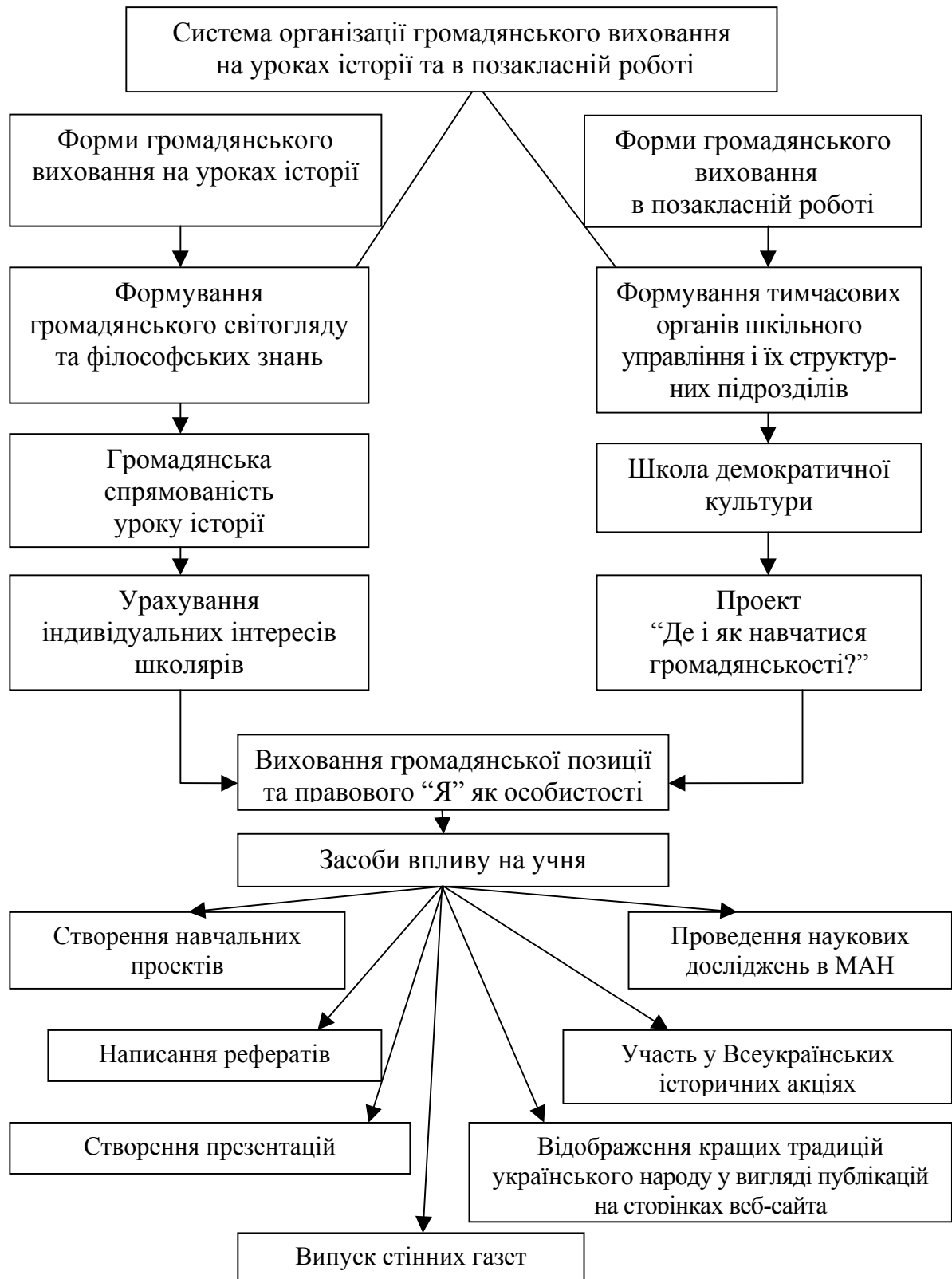
Рис. 1. Модель формування громадянського виховання школярів на уроках історії та в позакласній роботі

Вчитель історії має можливість засобом свого предмета, змістом історичного матеріалу, який вивчається, “формуванню позитивне ставлення до пізнавальної діяльно-