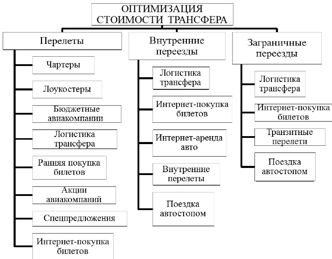
Рис. 3. Основные инструменты снижения стоимости трансфера

Изучение особенностей чартерных рейсов показало, что их могут использовать крупные операторы активных видов туризма, имеют стабильную клиентуру, при условии совпадения сезонности походов и регулярных чартеров. Самостоятельным группам удобнее использовать лоукостер [5].