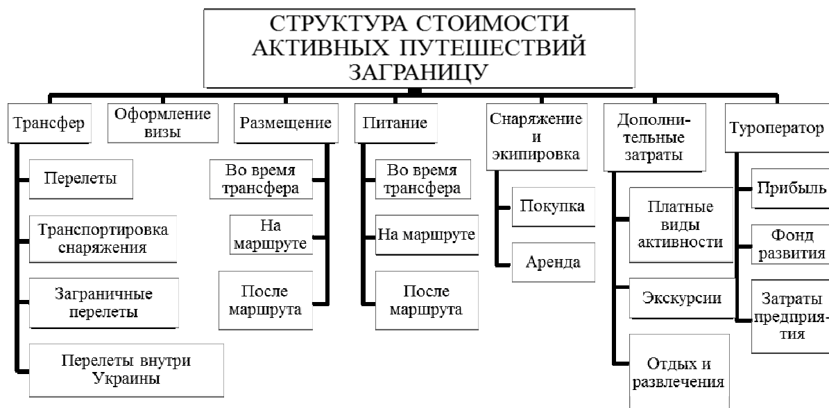
Рис. 1. Структура стоимости активных путешествий за границу

Стоимость любого тура состоит из стоимости: трансфера, размещения, питания, набора дополнительных услуг, в том числе: экскурсий, оформления виз, проката снаряжения, оплаты дополнительного персонала, дополнительных экстремальных активностей и аттракционов, комплекса расходов, составляющих накладные расходы туристического предприятия, фонда развития и планируемой прибыли (рис. 1).