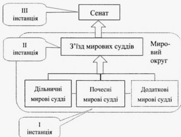
Рисунок 1 - Система мирових судів у Російській імперії за судовою реформою 1864 р.

Як відомо, запроваджуючи у другій половині XIX ст. мировий суд, царський уряд тим самим планував вирішити низку специфічних завдань. По-перше, дати населенню швидке та якісне правосуддя; по-друге, розвантажити загальні суди; по-третє, покращити ефективність поліції шляхом звільнення її від здійснення суто судових функцій. Відповідно до цих завдань й будувалася система мирових судів, яка повинна була забезпечувати як їх автономність від окружних судів, так і надавати інституту мирових суддів цілісності та внутрішньої погодженості. Одержавши ретельно продуману структуру з трьох інстанцій [1, с.36-37], мирові суди мали стати дієвим засобом втілення засад та принципів демократичного судочинства у місцеве життя, сприяти здійсненню справді гуманного правосуддя (рис.1).