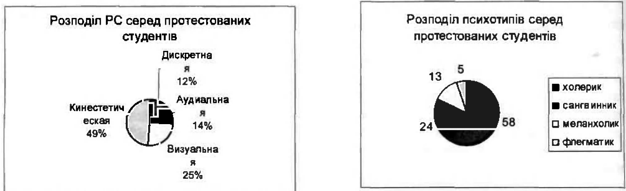
Рис. 1. Розподіл психотипів і PC серед протестованих студентів

Таким чином, метою дослідження є також виявлення наявності взаємозв'язку між зазначеними параметрами. Для проведення експерименту досліджуваній групі студентів (більше 500 чоловік) пропонувалося виконати ряд тестів: тест для визначення провідної репрезентативної системи [3], тест "Мотивація до навчання" [7], тест на визначення психологічного типу особистості [8]. За результатами тестування були побудовані діаграми розподілу різних ознак серед протестованих осіб, які навчаються. Далі, за допомогою кореляційного аналізу виявили залежність між досліджуваними параметрами.