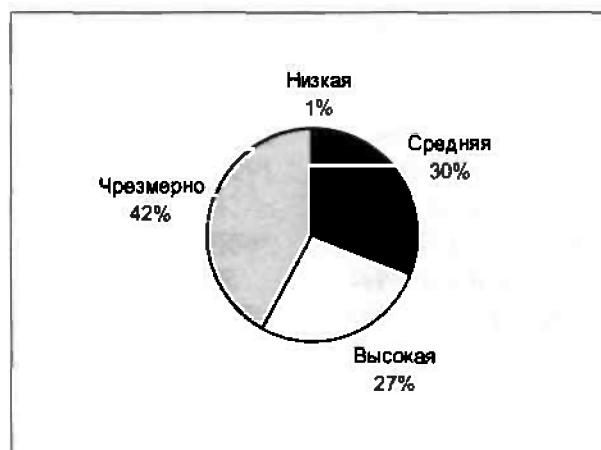
Рис.2. Розподіл мотивації до навчання серед протестованих студентів

Побудовані діаграми розподілу різних ознак серед протестованих студентів представлені на рис.1 та рис.2.