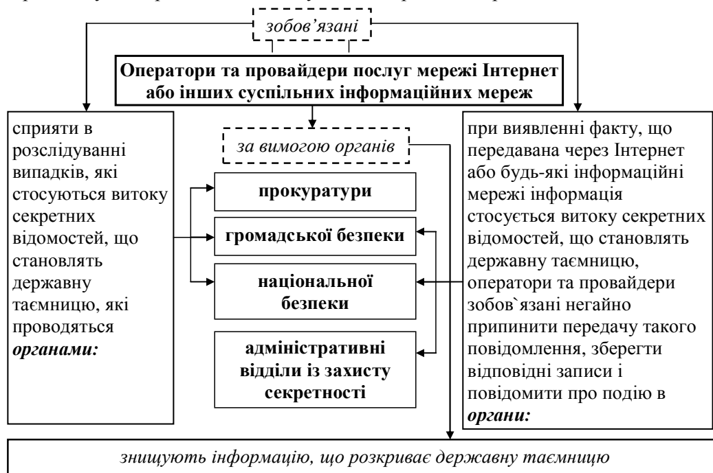
Рис. 5. Зобов'язання операторів та провайдерів послуг Інтернет у сфері державної таємниці в КНР

льних інформаційних мереж у сфері сприяння охороні державної таємниці. Схематично це зображено на рис. 5.