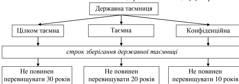
Рис. 1. Строки засекречування інформації в КНР

Строки засекречування інформації в КНР відповідно до ст. 15 Закону КНР «Про захист державної таємниці» [1] зображено на рис. 1.