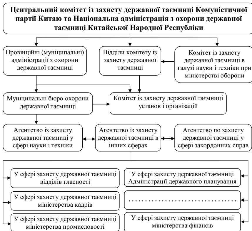
Рис. 3. Система адміністративних органів, що відповідають за охорону державних таємниць у КНР

жавної таємниці. Поряд із ним у КНР також існує аналогічний партійний орган – Центральний комітет із захисту державної таємниці, що підпорядковується Центральному комітету Комуністичної партії Китаю. В особливих адміністративних районах Китаю – Гонконгу і Макао – діє своя система класифікації та захисту секретної інформації [4]. Систему адміністративних органів, що відповідають за охорону державної таємниці в КНР, схематично зображено на рис. 3.