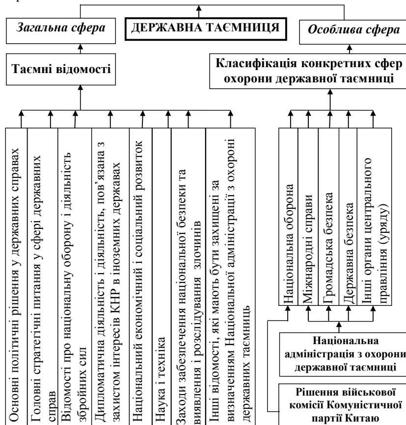
Рис. 2. Сфера охорони державної таємниці в КНР

Сфера охорони державної таємниці в КНР [3] зображена на рис. 2.