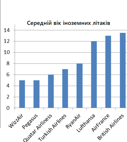
Рис.1. Середній вік літаків

Зважаючи на те, що більшість європейських нормативних актів у сфері авіації