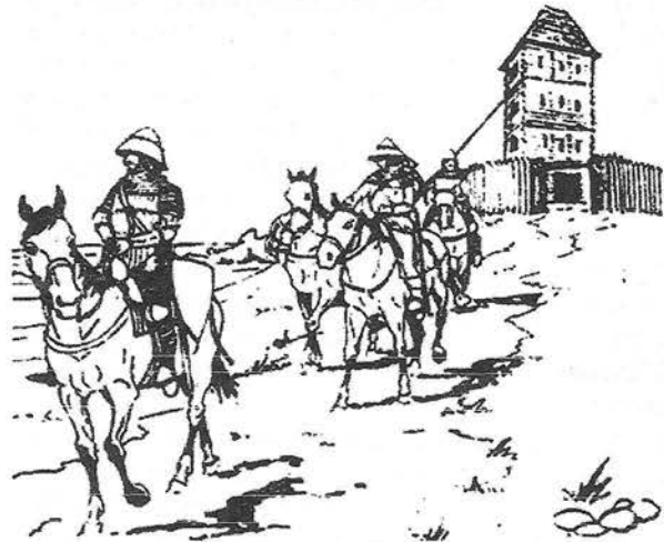
Рис. 2. Виїзд князівського урядника на чолі озброєного ескорту із замку (реконструкція А. Клейна).