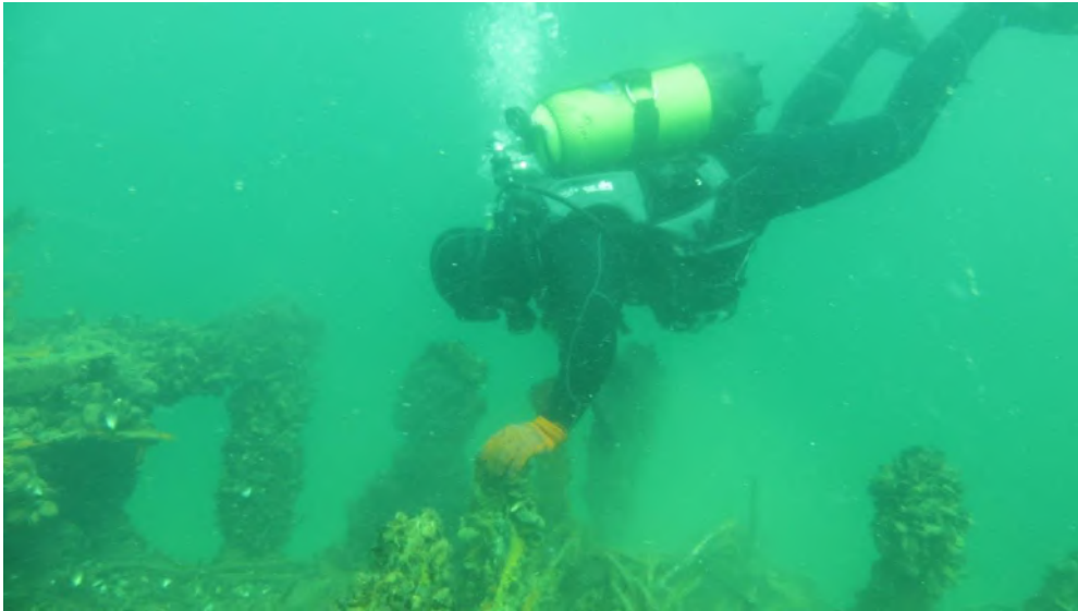
Рис. 2. Пошук вибухонебезпечних предметів під водою

Для вирішення поставленого завдання спочатку були проведені експериментальні дослідження, в яких брали участь випробовувані з числа особового складу відділення підводного розмінування групи піротехнічних робіт та спеціальних водолазних робіт аварійно-рятувального загону спеціального призначення Головного управління ДСНС України у Херсонській області. Вони на протязі весни-літа 2020 року виконували реальні операції пошуку (рис. 2) на глибині 4 м, 6 м та 7 м та підйому (рис. 3) з глибини 6 м, у тому випадку, коли була відсутня можливість знищення на місці, вибухонебезпечних предметів в акваторії Чорного моря, яка вимагає свого розмінування.