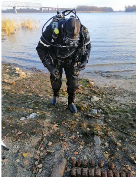
Рис. 1. Боєприпаси, вилучені з-під води в Херсонській області протягом одного дня

Тому проблема підвищення ефективності попередження надзвичайних ситуацій, пов'язаних з підводним розташуванням вибухонебезпечних предметів, є актуальною.