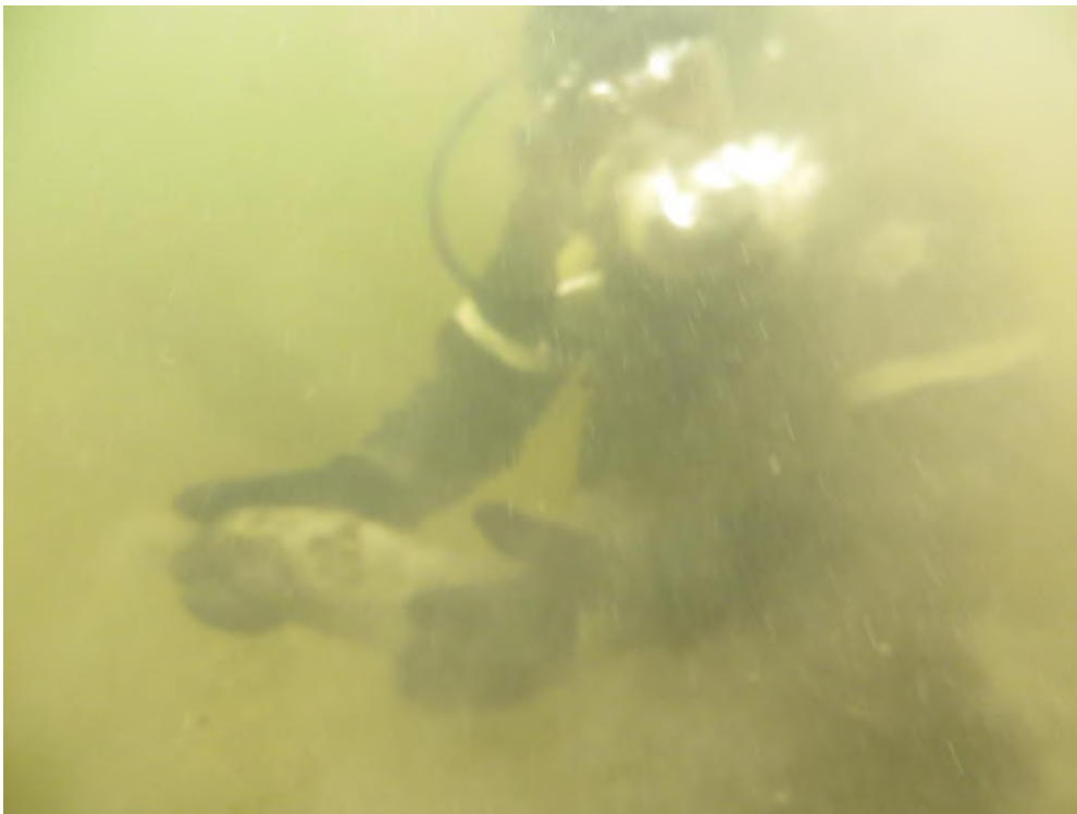
Рис. 3. Підйом вибухонебезпечних предметів з-під води