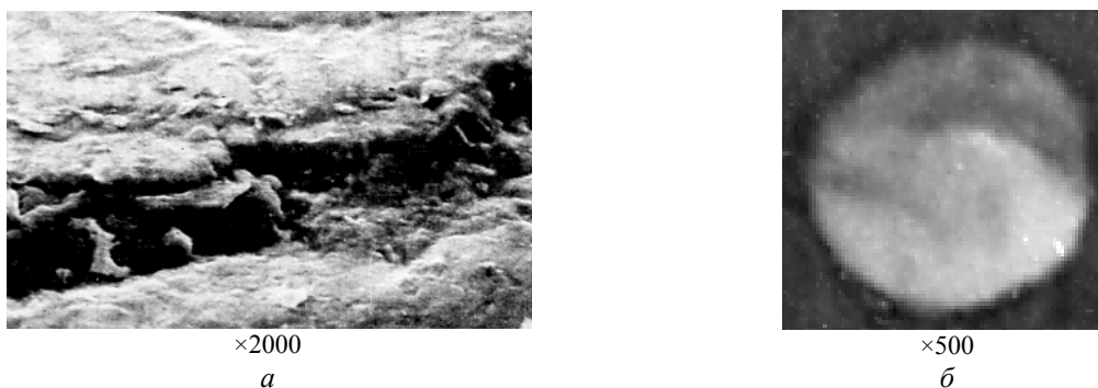
Рис. 1. Фрагмент покрытия (а) и дефект в виде капельной фазы (б)

Представим себе пространство, примыкающее к поверхности подложки, которое в процессе нанесения заполняется материалом покрытия и включениями. Заполнение происходит дискретно: один элемент материала покрытия — одна ячейка дискретизации объема последнего. Будем считать потоком событий последовательное совмещение элементов с ячейками. С учетом соотношения размеров покрытий и включений, а также их конфигурации (рис. 1), построим схему заполнения, представляющую собой двухмерное сечение объема покрытия плоскостью, перпендикулярной поверхности и конечное множество элементов, движущихся к покрываемой поверхности со своими (в общем случае, случайными) скоростями и образующими таким образом очередь на заполнение вакантных ячеек.