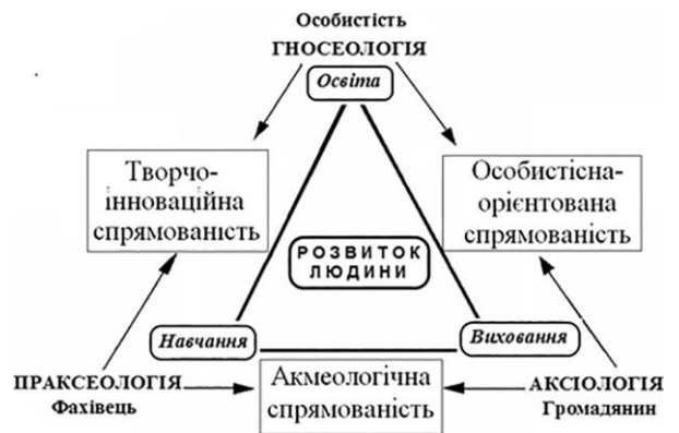
Рис. 2. Системна кореляція головних категорій педагогіки у контексті типів спрямованості педагога

до загальної теорії систем та місце у цій системі типів спрямованості викладачів ЗВО.