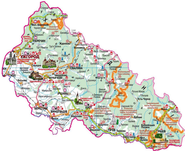
Рис. 2. Карта проживання русинів на території Закарпаття [4]

Землі сучасної Білорусії і велика частина земель сучасної України увійшли до складу нового центру збирання Землі Руської – Великого Князівства Литовського. Червона Русь увійшла до складу Польського королівства. Північний схід Русі (Володимиро-Суздальська Русь) опинилася під владою Золотої Орди, і тільки на півночі Пан Великий Новгород – «республіка» народного віча зберегла незалежність (цю землю скандинави називали «країною міст» – Гардарикою).