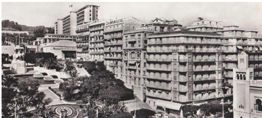
Рис. 3. Бульвар Хмисти (ранее Лаферриэр), XIX - начало XXст.

политическое и культурное значение, широко обсуждается в работах Набилы Улебсир. Автор, анализируя использование наследия Алжира в рамках колониальной культурной политики, показывает, как вопрос местного наследия в его арабском, берберском и мавританском измерениях был перенесен из сферы знаний истории и культуры Алжира в сферу практического применения в архитектуре и искусстве [14]. Однако использование мавританского наследия происходит задолго до колониальной политики XX века: этот стиль проявляется в работах местных архитекторов, которые построили первые церкви в Алжире в первой половине XIX века (собор Святого Филиппа (рис. 4) и церковь горы Кармель эль-Бьяр).