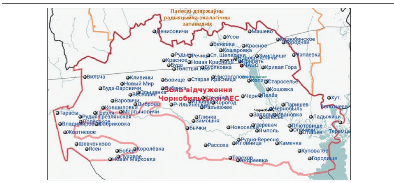
Рисунок 1. Населені пункти зони відчуження, з яких були евакуйовані чи відселені жителі [7] Figure 1. Settlements in the Exclusion Zone residents from which were evacuated or resettled [7]

According to the Law of Ukraine «On the legal regime of the territory affected by the Chernobyl disaster» [6], the Exclusion Zone is the territory from which the population was evacuated in 1986. Currently, the body responsible for state control over compliance with the legal regime of Exclusion Zone and of the resettled part of zone of unconditional (compulsory) resettlement is the State Agency of Ukraine for Exclusion Zone Management (SAEZ), which is located in Chernobyl city. At present, the territory with a total area of 259,837.8 ha (2,600 km 2 ) is in the sphere of SAEZ management, on which the 94 (Fig. 1) former settlements, ChNPP industrial site, radioactive waste disposal sites («Pidlisniy», «Chernobyl stage III», and «Buryakivka»), points of temporary localization of radioactive waste and other units are located. The total perimeter of Exclusion Zone and the zone