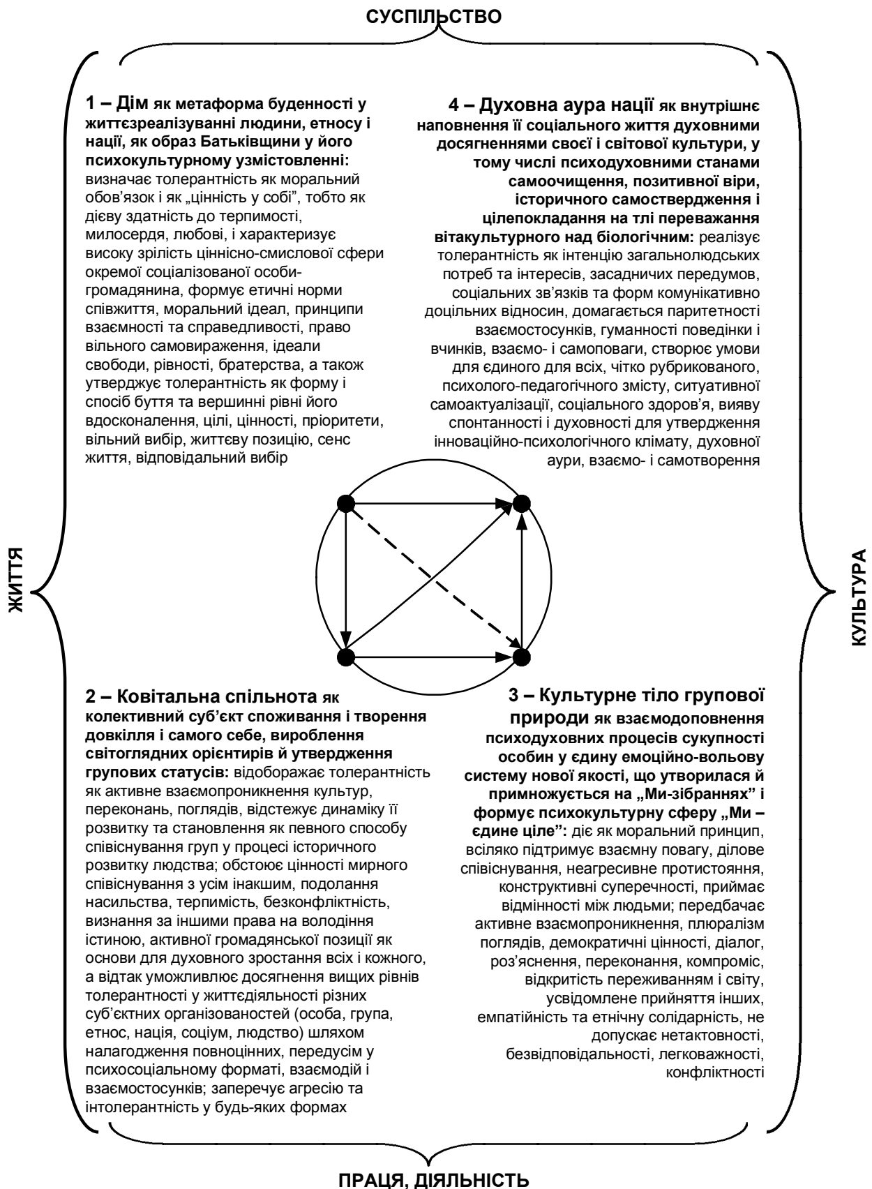
Рис. 3. Чотирисходковий інтерпретаційний шлях пізнання-творення локалізованого чи цілісного соціуму, зреалізований у методологічному форматі вітакультурного метапідходу та з орієнтацією на принципи, канони і нормативи толерантності