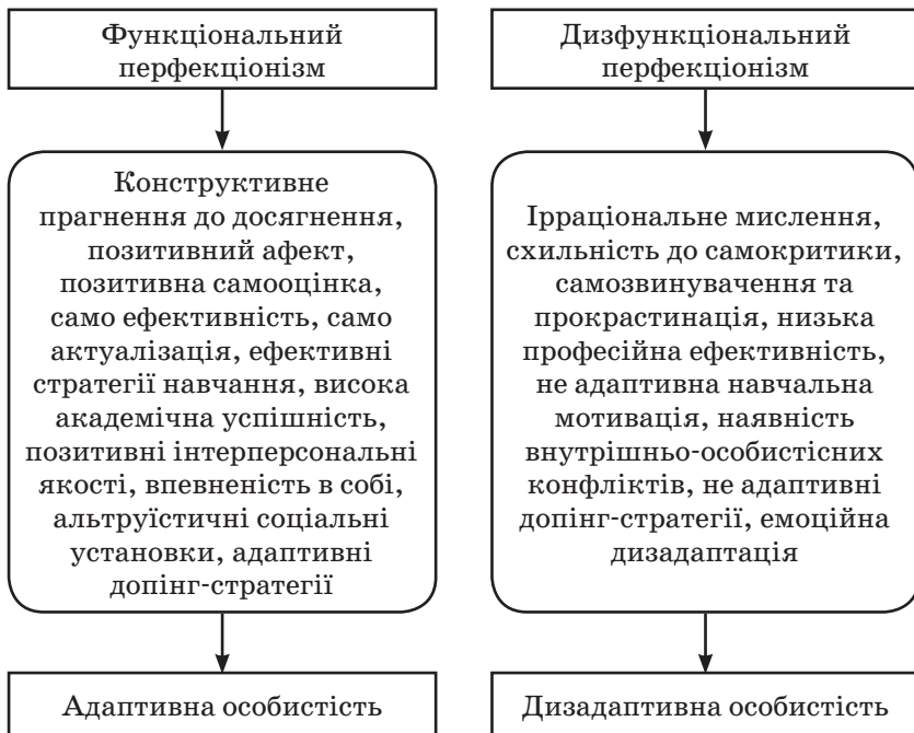
Рис. 1.1. Двокомпонентна модель структури перфекціонізму (за Р. Слейні)

ненням до успіху і критичним співвідношенням об'єктивних вимог і власних сил, від клінічного перфекціонізму, як дисфункціонального явища, яке шкодить гармонійному розвитку особистості.