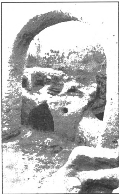
Мал. 4. Пустеля Келлії: кухня в одному з чернечих помешкань в Кукур ер-Рубайят.

[27, с. 62]. Одна апофтегма розповідає, як чернець зробив відмикачку, аби потрапити до кельї одного з братів і вкрасти у нього гроші [29, с. 320]. Деревина, як підкреслювалося, була рідкістю, і двері в Єгипті тієї епохи залишалися для пустельників дорогим задоволенням. За відсутності дверей при вході брати вішали циновку. Саме це і зробив авва Діоскор, коли віддав свої двері брату, який шукав їх для своєї кельї [25, с. 153]. В пахоміанських джерелах також можна знайти вказівку на те, що вхід у житло аскета прикривався навісною циновкою [33, с. 149]. Можливо, існували й засклені вікна, про що свідчать фрагменти скла, знайдені в Келліях біля деяких входів у помешкання анахоретів; в Скиту вчені теж виявили залишки скляних виробів [27, с. 62]. Разом з тим, автори Житій IV-V ст. наполягають, що відомі старці-харизматики і святителі отримували надприродне світло, котре дозволяло їм працювати як вдень, так і вночі [31, с. 309], проте це світло іноді походило від демона, як у випадку зі старцем, про якого розповідав Іоанну Кассіану авва Мойсей [12, с. 130].