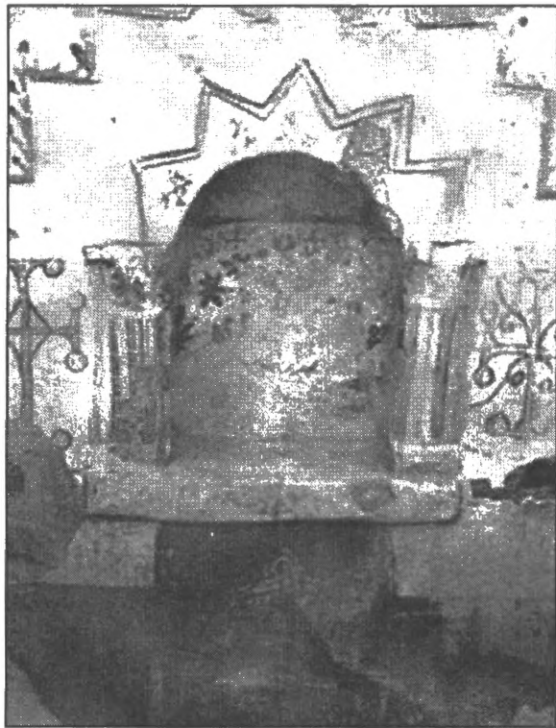
Мал. 2-Б. Пустеля Келії: ніша в стіні келії, призначена для молитви ченця.

слава починала притягувати до нього шанувальників та страждених, часто досить набридливих, виникала необхідність мати щонайменше дві кімнати, аби одночасно зберегти і усамітнення, і заповіді людинолюбності [27, с. 61]. Зазвичай у таких “двокімнатних” кельях також планувалися прихожа та коридор (див. мал. 3).