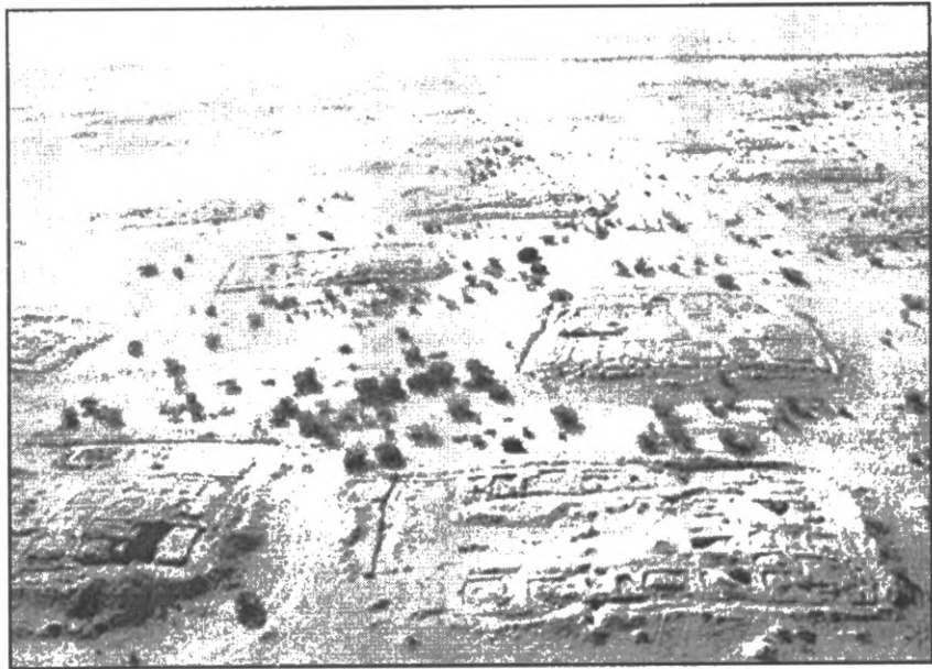
Мал. 1. Пустеля Келії: зйомка чернечих поселень в місцевості Кукур ель-Ізейла під час сезону археологічних розкопок 1981 р.

також, що в Келліях турбувалися про те, аби не будувати келії надто близько одна від одної, “так, аби жоден, як писав Руфін Аквілейський, не міг впізнати здалеку іншого, ні розгледіти його, ні почути його голосу” [21, с. 134]. За Філоном Александрійським, так само розташувалися в пустелі помешкання терапевтів (відгалуження іудейської аскетичної секти есеїв): не надто близько, щоб уникнути скупченості, але й не надто далеко, щоби можна було зібрати общину й прийти на допомогу [24, с. 125]. Отже, перші анахорети могли вільно вибирати місце поселення, яке б їх влаштувало, проте у подальшому (починаючи з V ст.), внаслідок збільшення загальної кількості ченців, зокрема киновитів, самітникам стало важко знаходити по-справжньому відлюднені місця, ще й такі, які б відповідали вимогам Макарія Великого.