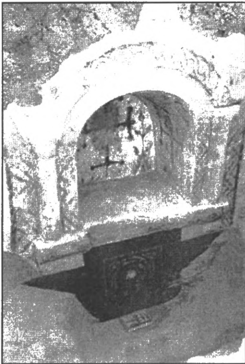
Мал. 2-А. Пустеля Келії: східна стіна чернечої келії, призначена для молитви.

Зион, наприклад, говорив з цього приводу: “Ніколи не покладай сподівань, коли будеш келью” [11, с. 64], маючи на увазі, що справжній аскет-самітник ніколи не повинен залишатися на одному місці більше трьох-п’яти років. Щоправда, з VI ст. таке “мандрування” анахоретів пустелями Християнська Церква засудила і до початку VII ст. майже повністю викоринила.