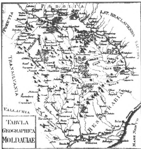
Карта Молдавії Д. Кантеміра (1716 р.)