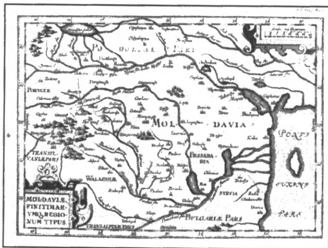
Карта Молдавії Г. Райхерсторфа (1541 р.)