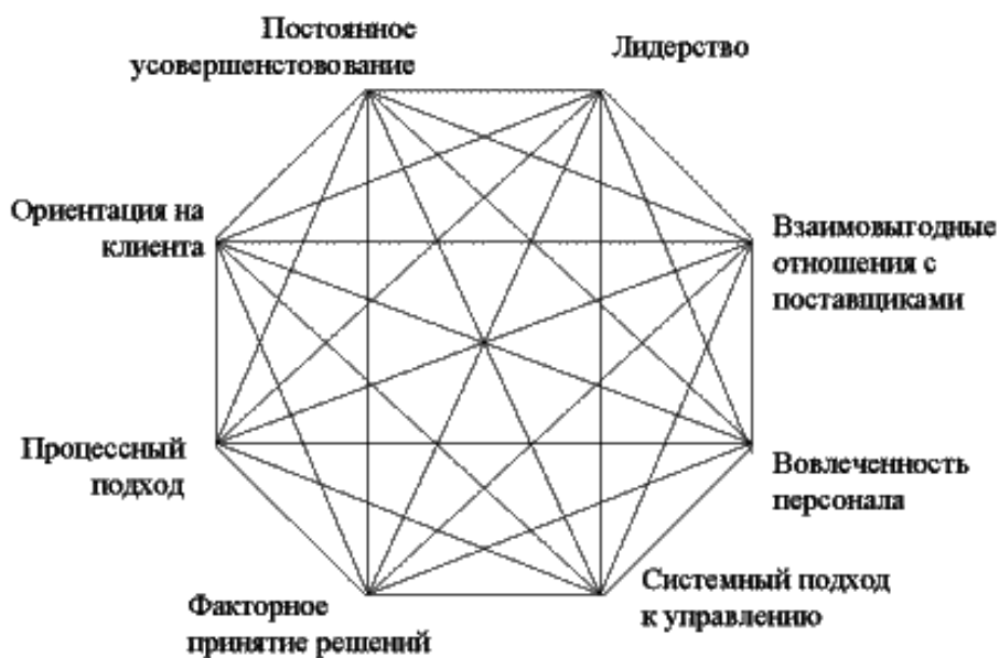
Рис. 5. Восемь принципов управления, лежащие в основе ISO 9000:2000

Соответственно количество принципов системы УК увеличилось с 8-и (рис. 5) до 12-ти (табл. 2).