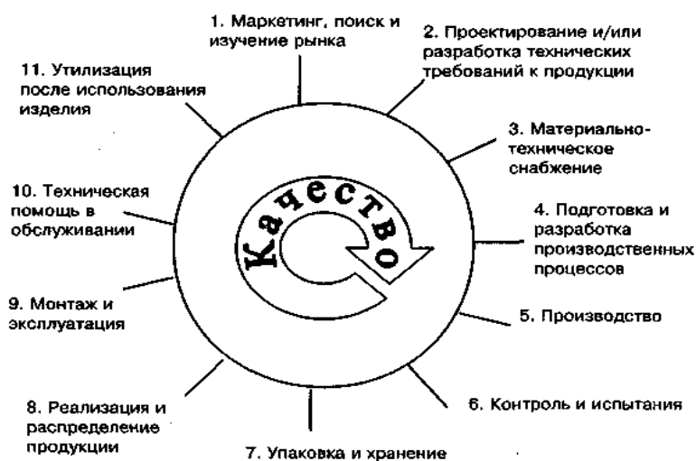
Рис. 2. Типичные этапы жизненного цикла продукции