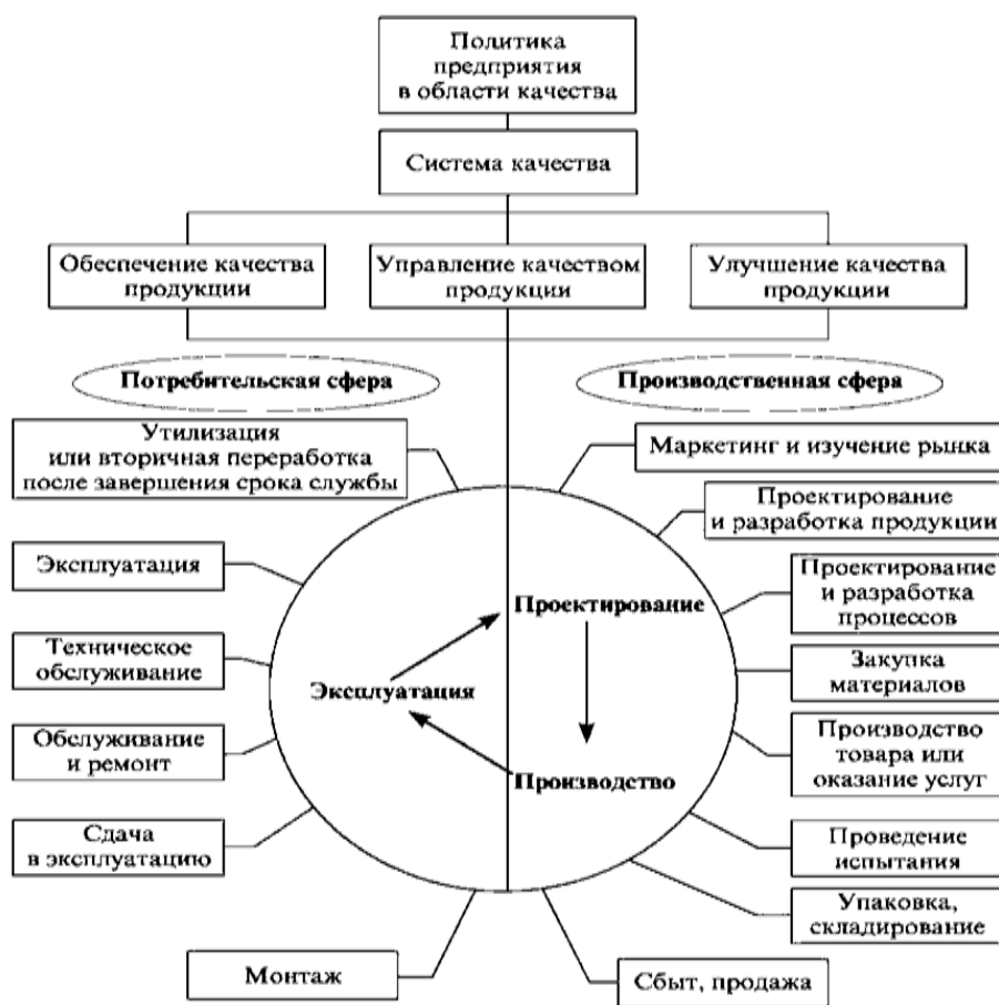
Рис. 3. Управление качеством продукции