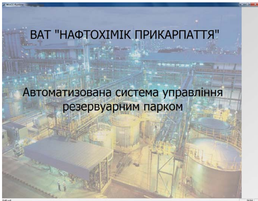
Рис.1. Стартове вікно проекту в SCADA WinCC