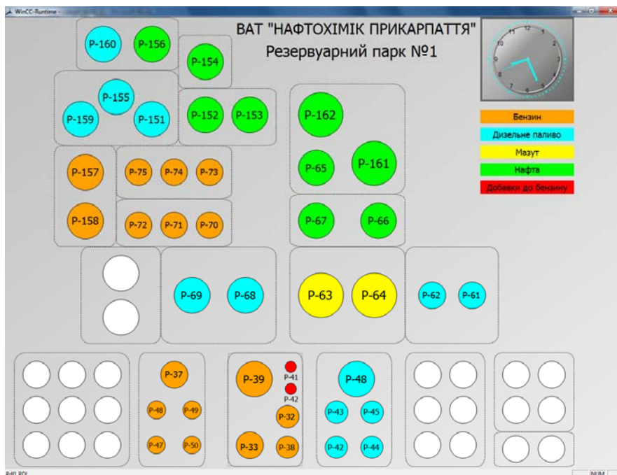
Рис.2. Функціональна схема резервуарного парку

Функціональна схема резервуарного парку №1 рідких вуглеводнів ВАТ «Нафтохімік Прикарпаття» (рис.2) включає схему розташування груп резервуарів з їх номерами, позначених відповідним кольором в залежності від виду нафтопродукту.