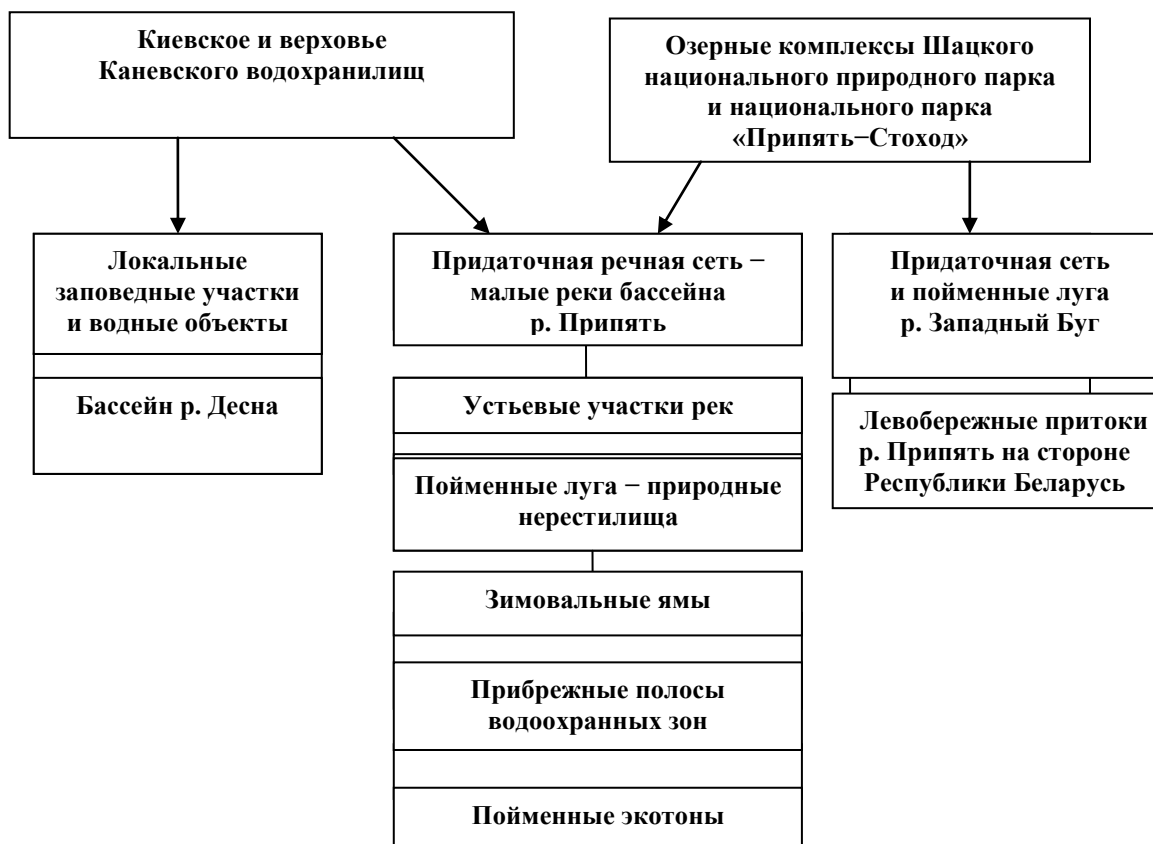
Рис. 1. Структура трансграничного іхтіоекологічного резервату «Верхній Дніпр»

* Примечание: необхідно відзначити наявність в устьєвих участках сформованих бригад браконьєрів (верхів'ї р. Прип'ять, устя рек Стырь-Горыньського відновительного іхтіокомплексу).