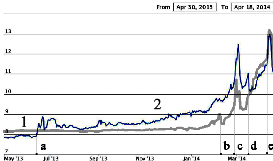
Рис. 1. Графік середнього міжбанківського курсу гривни до долару (1) та WMU до WMZ (2) в період з 30.04.2013 по 16.04.2014.

Саме на цей період припали санкції проти українського представництва WebMoney з боку державних органів [4, 5, 6]. Також на вказаний період припадають значні валютні коливання гривни внаслідок політичної нестабільності в країні. В якості джерела даних про валютний курс WMU відносно WMZ за досліджуваний період використовувався он-лайн сервіс http://wm.exchanger.ru/asp/wmlist.asp . Для дослідження даних щодо середнього міжбанківського курсу гривни до долару використовувався он-лайн сервіс http://bin.ua/charts/nbu_chart.html .