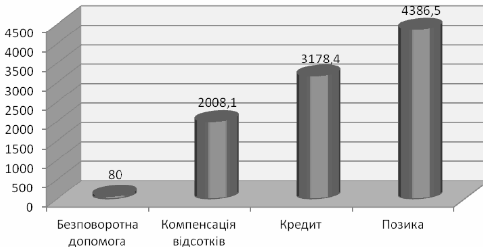
Рис. 2. Фінансування програм розвитку малого підприємництва за різними видами фінансової підтримки, тис. грн.

Протягом 2011 року фінансування здійснювалося за різними видами фінансової підтримки (див. рис. 2) [3].