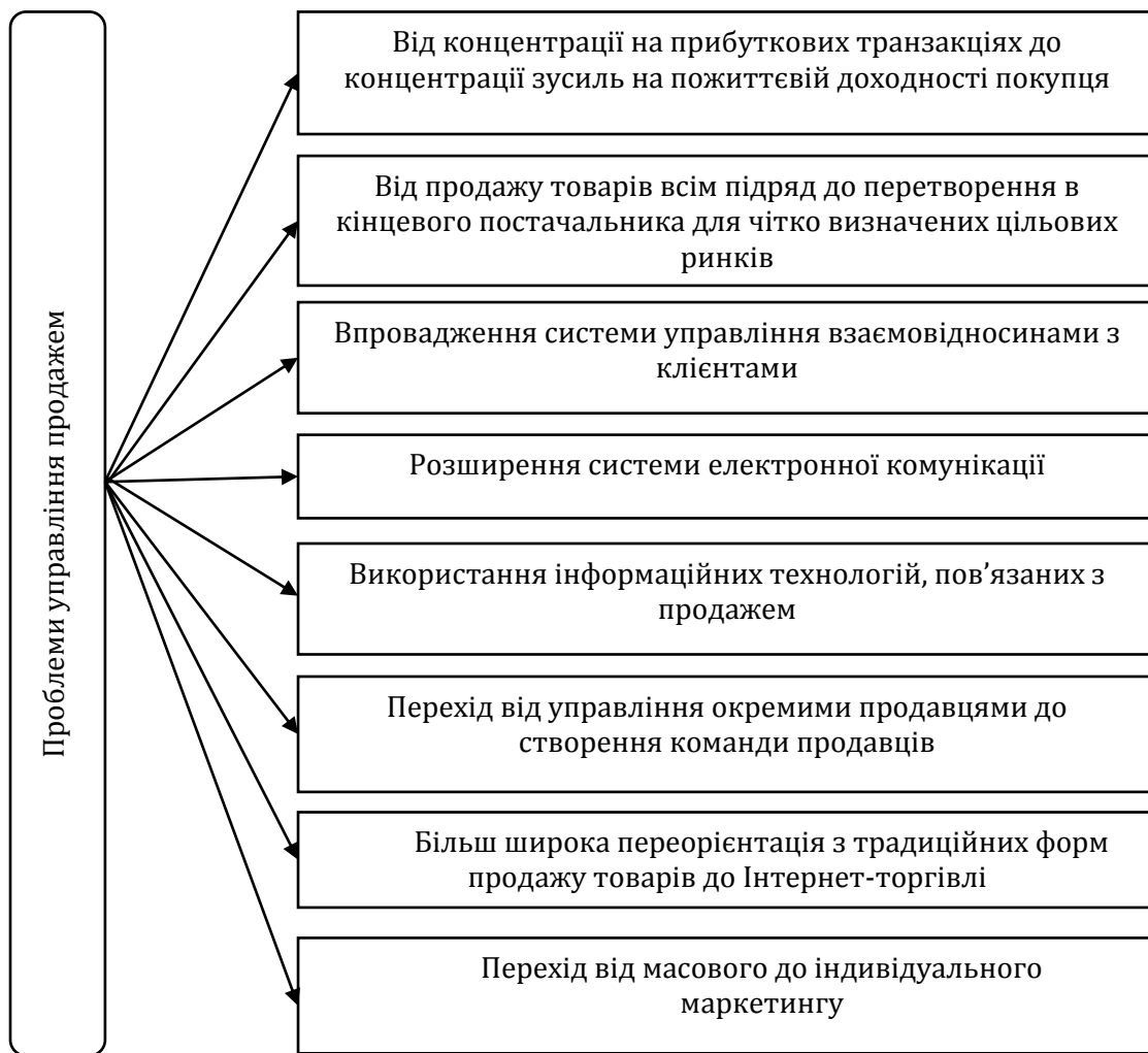
Рис. 2. Різновиди сучасних основних проблем управління продажем