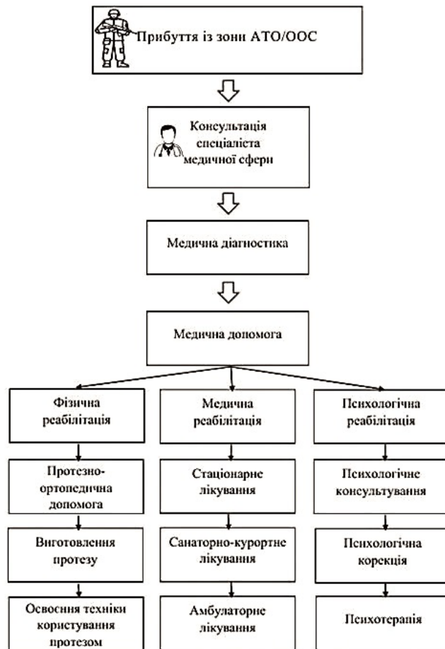
Рис. 2. Схема вибору програми реабілітації