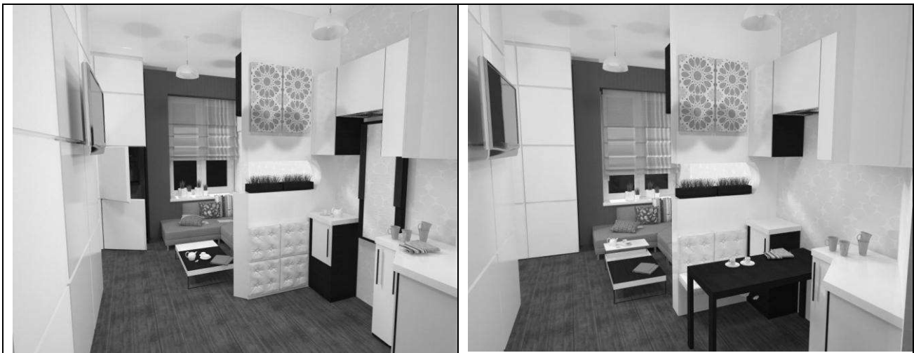
Рис.1 Приклад розмежування житлового простору за допомогою площинних перегородок

Інший вид варіантного планування можна отримати за допомогою площинних перегородок у вигляді щитів різних конструкцій, що встановлюються в пази верхніх і нижніх направляючих елементів.[2] Якщо в таких стінових елементах, а точніше в меблевих щитах, передбачені закладні вертикальні профілі, то це забезпечує вертикальне навішування окремих виробів корпусних меблів з однієї або двох сторін (Рис.1).