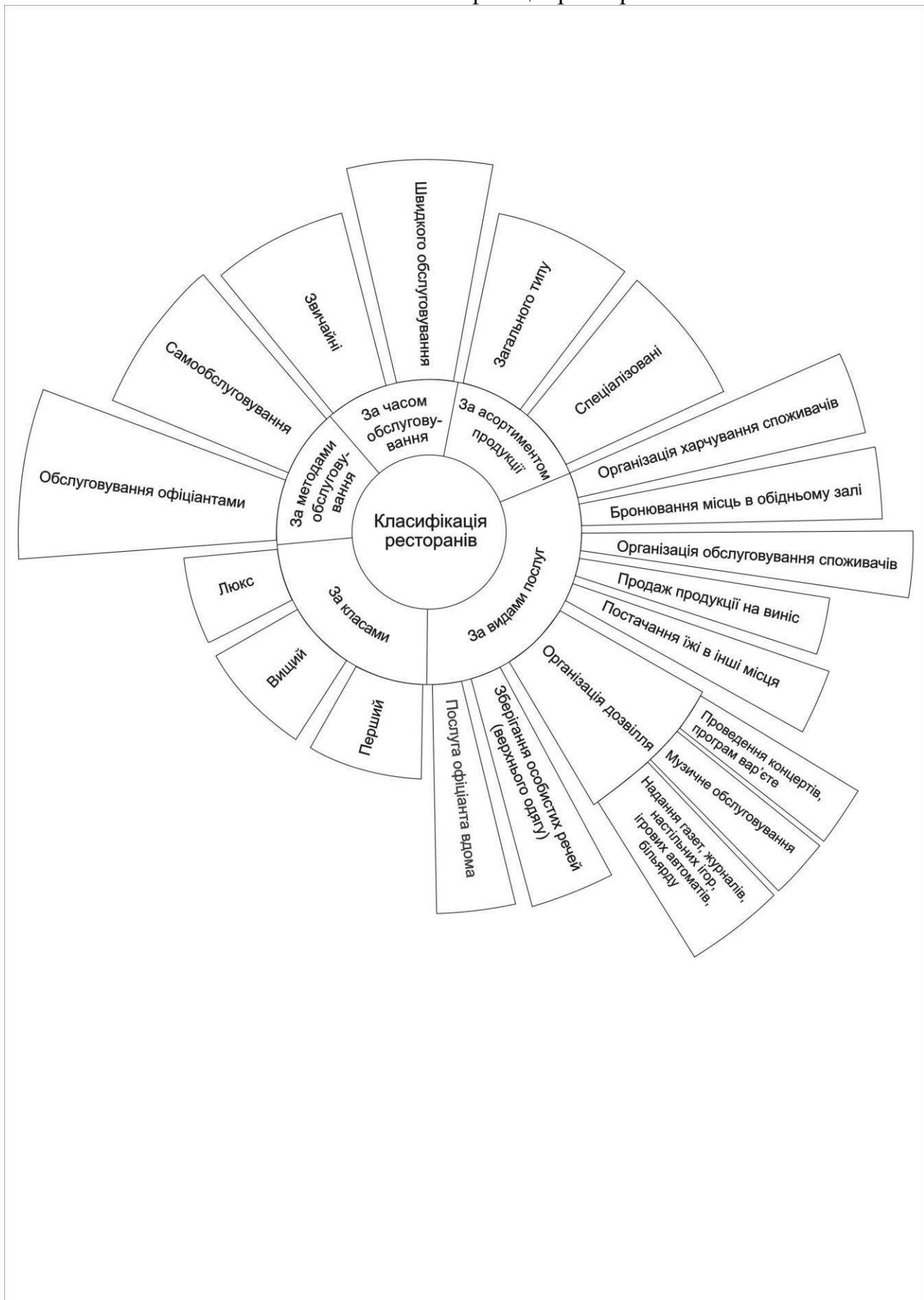
Табл. 1. Класифікація ресторанів