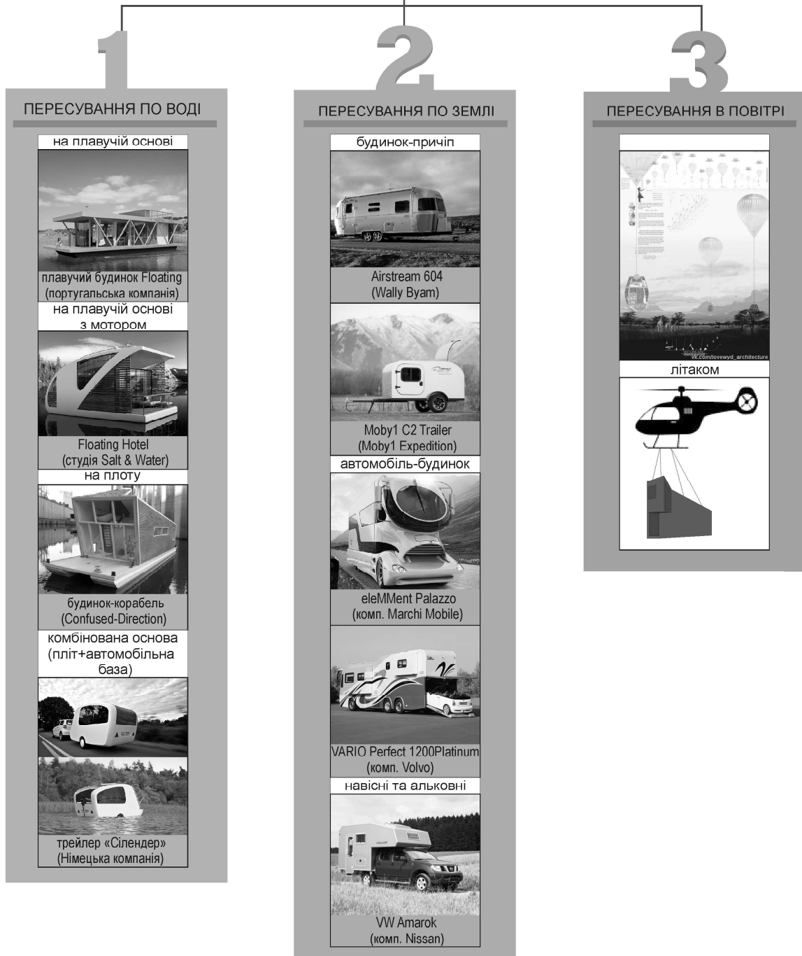
Рис. 1. Принцип адаптивності