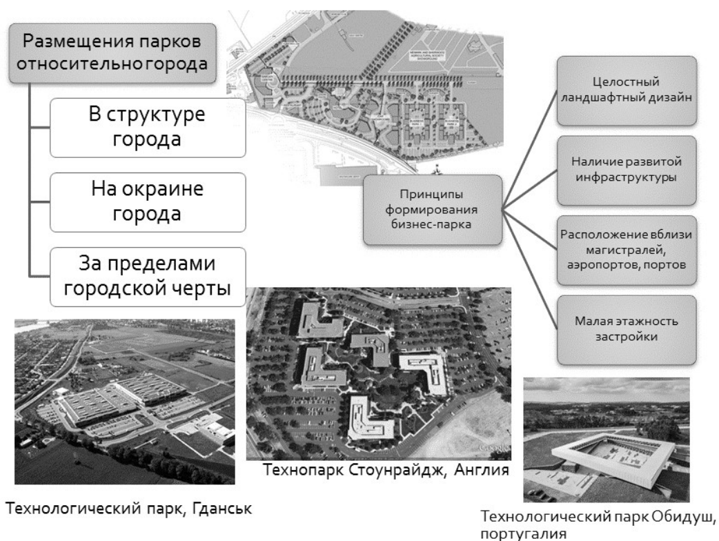
Рис. 3. Основные принципы формирования бизнес-парков.

Располагать их желательно в периферийных районах города или в пригородной зоне, что обеспечит возможность подключения или использование существующих инженерных сетей, при этом должна быть обеспечена удобная транспортная доступность. Существующие магистрали и застроенные территории, граничащие с участком строительства, не должны ограничивать возможность дальнейшего его развития. Планировка и застройка участка территории бизнес-парка должна отвечать ее функциональному назначению и общей концепции, при этом не желательно использовать многоэтажную застройку, большое внимание уделяется устройству паркинга с достаточным количеством машино-мест, созданию инженерной и социальной инфраструктуры. В последнее время наблюдается тенденция к созданию