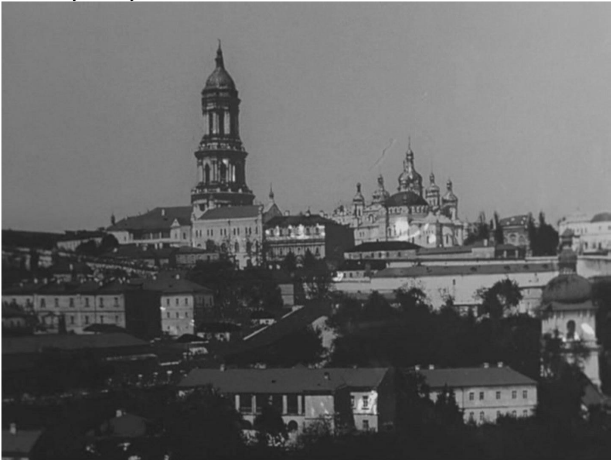
Рис.2. Загальний вигляд Верхньої Лаври з Дніпра. Листівка поч. XX ст.

Важливу роль в формуванні двох ансамблів відігравали зелені насадження, які формували природний фон навколо соборів, але не заважали їх всебічному огляду.