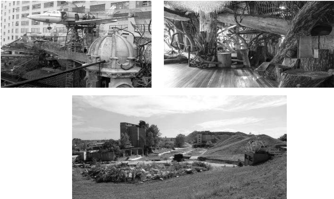
Рис. 8. Міський музей (вверху) та Cementland (не добудований майданчик для екстремальних ігор в приміщенні колишнього цементного заводу внизу). Сент-Луїс, США.

Висновки. Визначено напрямки розвитку дитячих ігрових просторів у містах - екологічний, біопсихологічний, соціальний, мистецький, розважальний. Визначено основні сучасні тенденції в проектуванні міських дитячих ігрових просторів на містобудівному рівні : тенденція відкриття «місця», «виробництво» унікальних ігрових просторів, які покращують естетику міського середовища та претендують на центри соціальної комунікації і містобудівні доміанти; тенденція відмови від ізоляції, тобто ігрові простори розповсюджуються на всій території міста і з'являються у несподіваних місцях. На об'єктному рівні відбувається ускладнення типів і видів ігрових просторів для дітей; розмиття меж дитячого ігрового простору і простору розваг для дорослих; формування інклюзивних просторів та інтерактивного ігрового середовища. На рівні предметного наповнення ігрових просторів спостерігається: поєднання високо індустріального ігрового устаткування з унікальними авторськими формами ігрових елементів; динамічність обладнання за рахунок використання ігрових інсталяцій; синтез мистецтв, дизайну, ергономіки та ігри; використання інтенсивних контрастних кольорових гам; ергономічність елементів; використання принципів універсального дизайну.