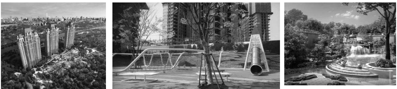
Рис. 6. Нові мікрорайони в китайських мегаполісах та їх благоустрій. Пекін.

Для Китаю на сучасному етапі характерний високий темп урбанізації та всі пов'язані з нею проблеми. Історично дитячі ігрові майданчики в цій країні не були традиційними елементами міської забудови, але зараз при плануванні нових мікрорайонів, включення дитячого ігрового простору в загальну інфраструктуру стає практично обов'язковим, а облаштування території включено в загальну вартість житла (рис.6).