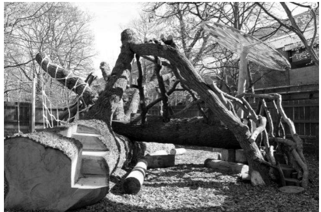
Рис. 1. Ігрове обладнання дитячих майданчиків, форми якого надихаються природою (nature inspired playground)

Біопсихологічний напрям характеризується спрямованістю на гармонійний розвиток фізичного тіла дитини, її психіки, соціальної адаптації та когнітивних здібностей, з урахуванням потреб різних вікових груп дітей. В проектуванні дитячого ігрового обладнання приймають участь фізіологи, ергономісти, психологи та інженери. Методики проектування базуються на сучасних педагогічних концепціях, в яких гра визнається видом пізнання дійсності і навчання дітей (рис.2).