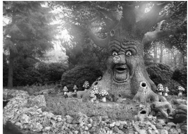
Рис. 5. Парк Ефтелінг- парк розваг у стилі фентезі, побудований за мотивами стародавніх легенд, міфів, казок та фольклору Голландії: план та вигляд Казкового лісу у Чарівному королівстві. Площа парку – 65 га.

Отже, на сьогодні слід говорити про поняття дитячих ігрових просторів міста як сукупності невеликих просторів, призначених для ігор, розваг, фізичних вправ, культурно-просвітницьких занять та художнього виховання дітей в оточуючому міському середовищі. Традиційно в рамках системного підходу ігрові простори ми розглядаємо як системний міський об'єкт, що має відповідні масштабно-ієрархічні рівні , котрі відповідають розмірам дитячих ігрових просторів, значенню їх в структурі міста, складу функціональних зон та ступеню досяжності населення. Виділяються декілька рівнів міських ігрових просторів для дітей: