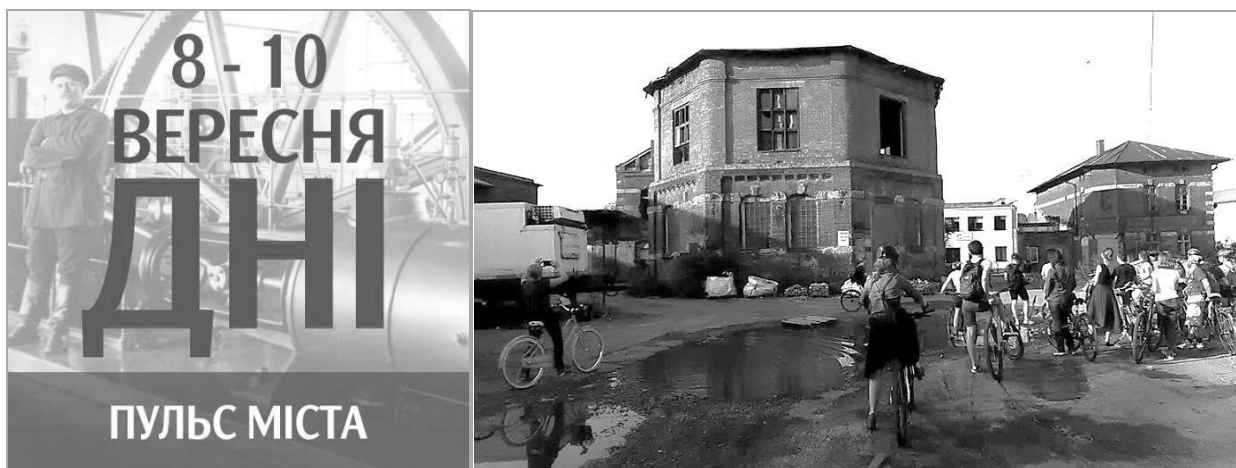
Рис. 7. Львів, Підзамче. Велопрогулянка по старих промислових підприємствах.

Дні європейської спадщини відбулися у Львові 8 - 10 вересня 2017 року. Вони вже традиційно відбуваються щоразу у країнах, які приєдналися до Європейської культурної конвенції. Львів бере участь у проекті сьомий рік поспіль. Це дні, коли маловідомі закриті споруди відчиняють двері для відвідувачів і розповідають історії, що приховані за їхніми фасадами. "Пульс міста: фабрики, шпиталі та освітні заклади" – фокус програми 2017 р. (рис. 7).