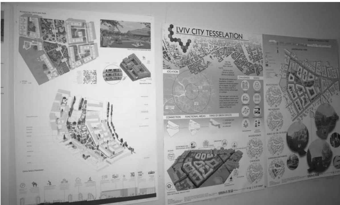
Рис. 1-3. Виставка результатів австрійсько-українського воркшопу Urban Density Lab 2017 у Львівській міській раді, вересень 2017 р.