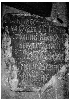
1. Надгробок Г. І. Вердеревського. Фото

Плита мало розміри 72 x 54 x 3 см. На плиті з двох її боків були зроблені