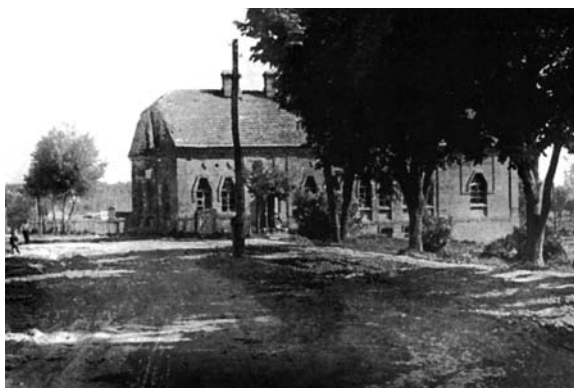
15. Видгляд будівлі цеху №1 артлі «Художній керамік» (створений для Опішненського гончарного навчально-показового пункту) зі сторони центрального входу. Опішне, 1949–1950. Подано за: [24, с.44]

музею-заповідника українського гончарства в Опішному Миколою Коею. Більшість кахлів задимлені всередині, що свідчить про їх використання у печах. На мою думку, вони могли прикрашати печі, які використовувалися для опалення приміщення школи.