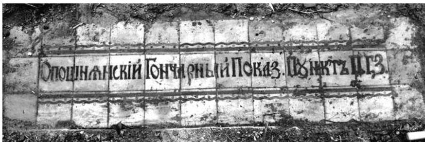
8. Збережена частина підлоги Опішнянського гончарного навчально-показового пункту з написом. Опішне, 1915.

тектурно-будівельної кераміки, виготовленої в цьому закладі — плитки для підлоги (рис. 10–11). За кольором та особливостями декору вони подібні до тих, які виготовлялися для каплиці, але відрізняються квадратною формою (зі стороною 18,5 см).