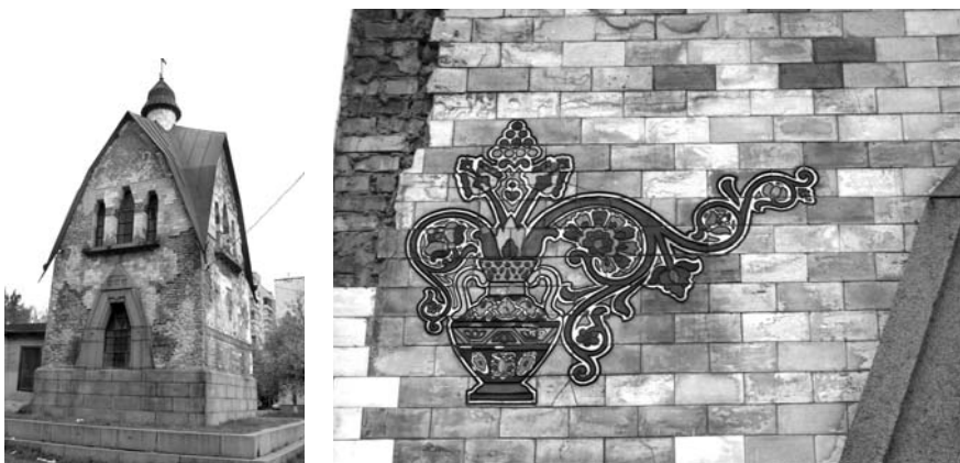
1–5. Каплиця, побудована на честь зустрічі представників Полтавської губернії з імператором Миколою II під час урочистостей з нагоди 200-річчя Полтавської битви. Полтава, 1911–1914. Фото Олени Щербань, 2007

У звіті Полтавської губернської земської управи за 1913 р. про діяльність «гончарного показового пункту» записано, що плитку для личкування каплиці було виготовлено в другій половині 1913 р. інструктором пункту «в приміщенні гончарної майстерні повітового земства за участі кустарів» [3, с. 128].