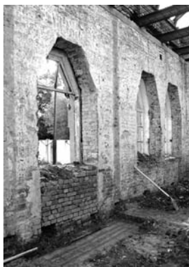
6. Момент виявлення фрагментів підлоги Опішнянського гончарного навчально-показового пункту. Опішне, жовтень 2007 р.