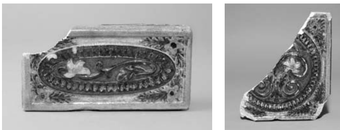
12–14. Фрагменти кахлі. Опішне, Опішнянська гончарна навчальна майстерня, 1915–1916. Фонди Національного музею-заповідника українського гончарства в Опішному, НД-1716, НД-1717. Фото Тараса Пошивайла, 2007

й окремі опішненські гончарі, які співпрацювали з Опішненським гончарним навчально-показовим пунктом. Зокрема, в 1997 р. під час розкопок у Полтаві експедицією Центру охорони та досліджень пам'яток археології Полтавської обласної державної адміністрації виявлено плитку, підписану «Симеон Горілей Опішне». Вона трапецієподібна (висота 15,8 см, ширина 13 см, товщина 1,05–1,08 см), відтиснута в формі. Має вигляд стилізованої капітелі, верхня частина якої вкрита ангобом синього кольору, полив'яна [21, с. 171–172]. Її автор — відомий гончар першої третини ХХ ст. Семен Сергійович Горілей. На мою думку, плитку виготовлено в 1910-х, під впливом діяльності Опішнянського гончарного навчально-показового пункту. Дерев'яні форми для виготовлення подібних личкових плиток знайдено на садибі опішненського гончаря Федора Пошивайла, який також почав активно працювати з 1910-х.