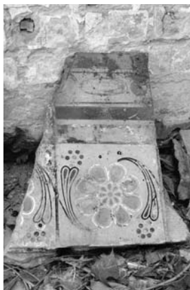
Рисунок А. Щербаня