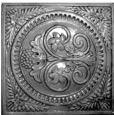
16. Кахля з тавром. Опішне, Опішнянська гончарна навчальна майстерня, 1915–1916. Фото А. Щербаня, 2007.